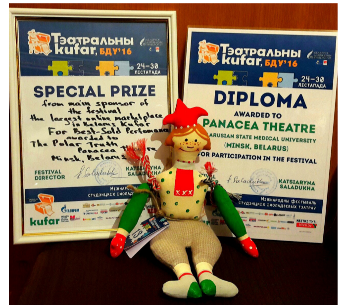
Награды «Панацеи» (Тэатральны Куфар-2016)

Конец марта 2017 года – дата рождения новой творческой инициативы прославленного коллектива - «Театральной недели с «Панацеей», заключительным победным аккордом которой вновь стало успешное подтверждение почетного звания «Народный любительский коллектив Республики Беларусь», которое впервые было присвоено агитационно-художественной бригаде в 1980 году.