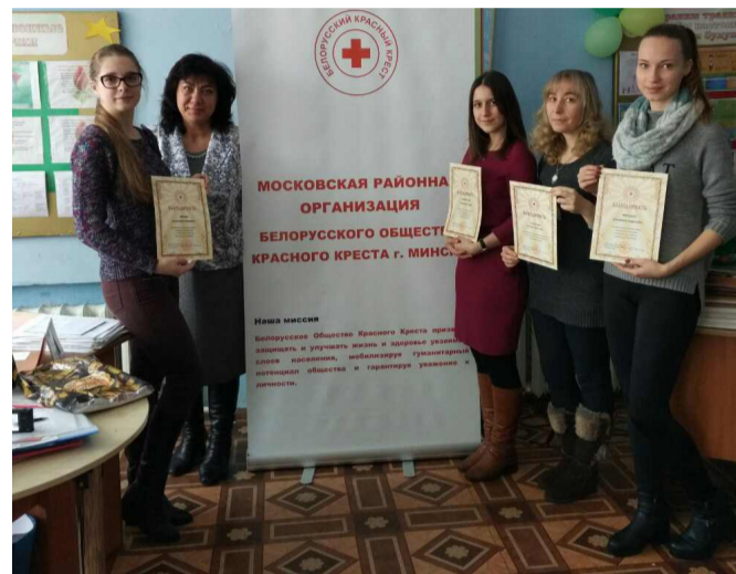
Дипломирование волонтеров БГМУ

шек и дедушек, либо их вовсе нет. Поэтому общение – это одно из основных требований в работе волонтеров проекта «Доступная медицинская помощь и уход». Также волонтеры становятся своеобразными посредниками между внешним миром и самим подопечным, помогая контактировать с основными городскими учреждениями.