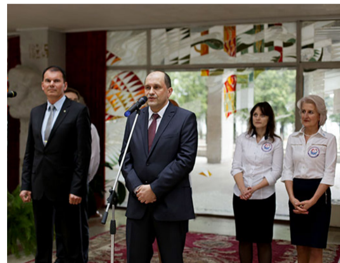
На открытии 28-х Дней лечебного факультета

- Вы знаете, каждый курс по-своему прекрасен. Первый – своей детской непосредственностью. Шестой – детской, все равно детской, но взрослостью, ведь они считают, что они уже взрослые, что уже все схватили.