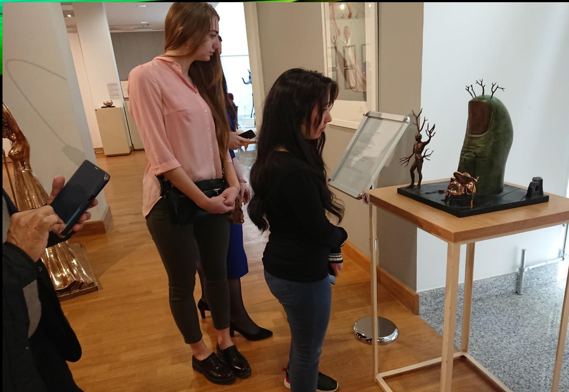
"ПАЛЕЦ СЕЗАРА ИЛИ ВИДЕНИЕ АНГЕЛА"