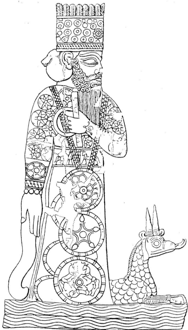
Изображение верховного бога Мардука

Новый год в Вавилоне отмечали в день весеннего равноденствия – в это время природа просыпалась от зимнего сна. Праздник был установлен в честь покровителя города – верховного бога Мардука.