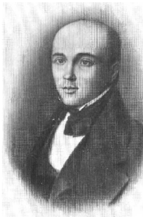
Рис. 1. Н.И. Пирогов. 1840 г.