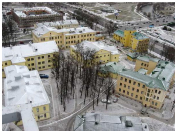
Рисунок 2. 3-я городская клиническая больница

С 1921 г. работал в Минске в гинекологическом отделении 1-й Советской (ныне 3-й клинической) больницы (рис. 2).