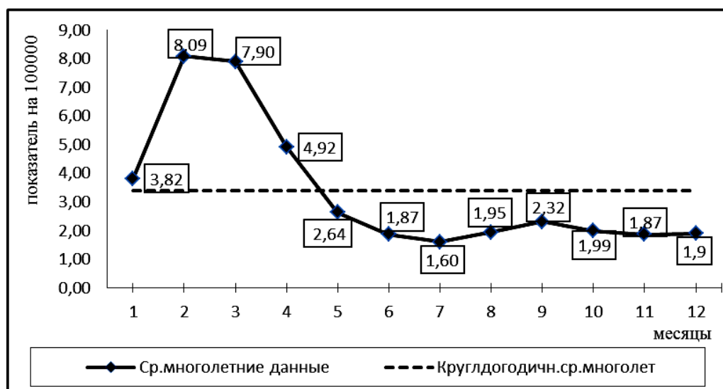
Рис. 2. Годовая динамика заболеваемости аскаридозом населения Минской области в 2005-2015 гг.

Анализ инвазированности аскаридами социально-возрастных групп населения показал (рис. 3), что наиболее высокая заболеваемость отмечалась среди детей 7-14 лет (38,1%). Доля заболевших среди 3-6 летних детей составила 31,6%, а на группы населения 15 лет и старше и 0-2 года пришлось по 19,2% и 11%, соответственно. Стоит отметить, что удельный вес групп населения с максимально высокими показателями заболеваемости составлял всего 8% среди детей школьного возраста (7-14 лет) и 4% – в группе детей, посещающих учреждения дошкольного образования (3-6 лет). Анализ численности социально-возрастной