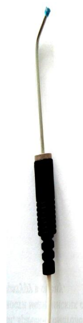
Рисунок 3 — Адаптированный активный электрод

Определение пороговой чувствительности проводится следующим образом. Активный контактный элемент фиксируют в рукоятке держателя. Пассивный электрод V-образной формы укладывается на нижнюю губу. При этом площадь контакта пассивного электрода со слизистой оболочкой на 1–2 порядка больше площади поперечного сечения контактного элемента активного электрода. Пациента необходимо предупредить, что при появлении покалывания, легкой вибрации, ощущения кислого в месте контакта со слизистой, он должен произнести звук «А!». При возникновении первых ощущений врач прерывает электрическую цепь. На дисплее фиксируется пороговая сила тока, вызвавшая ответную реакцию — раздражение слизистой. Данные чувствительности конкретных зон слизистой оболочки проверяемого участка используются в диагностике гиперестезий. В норме у пациентов от 22 до 70 лет средняя чувствительность слизистой оболочки кончика языка составляет 46 \text{ мА/мм}^2 . У женщины — 42 \text{ мА/мм}^2 , у мужчин — 51 \text{ мА/мм}^2 .