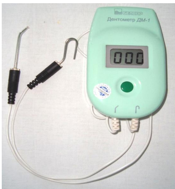
Рисунок 2 — Дентометр

Для определения значимости электрохимических потенциалов протезов и их разницы в этиопатогенезе непереносимости необходимо оценить функциональное состояние как рецепторного аппарата полости рта, так и центральных структур нервной системы. С этой целью используется электроодонтометр ДМ-1 или аналогичный (производство Республика Беларусь) (рисунок 2). Для повышения точности измерений и удобства в использовании предложен и заменен в аппарате адаптированный для этих целей активный электрод (патент № 2033077 от 20.04.1995, РФ) (рисунок 3).