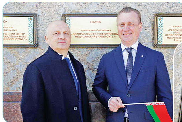
медицинский вуз страны, решающий важную государственную задачу – подготовку высоко-

По итогам конкурсного отбора среди научных организаций на Республиканскую доску Почета занесено учреждение образования «Белорусский государственный медицинский университет» как ведущий