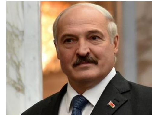
Александр Григорьевич Лукашенко

Республика Беларусь - унитарное демократическое социальное правовое государство (ст.1 Конституции Республики Беларусь), государственно - регулируемая рыночная экономика!