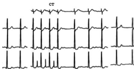
Рис. 2. Изменения электрокардиограммы при пробе чреспищеводной электрической стимуляцией предсердий у пациента К., 43 года

Критерии оценки пробы. Положительным результатом пробы считается появление на высоте стимуляции ишемического (горизонтального или косонисходящего) сегмента ST (на 2 мм и более). Однако более специфичным критерием положительной пробы является смещение сегмента ST ишемического характера на 0,1 мВ и более горизонтального или косонисходящего типа длительностью 0,08 с после точки j в первом и последующих комплексах ЭКГ постстимуляционного периода. Пример оценки пробы приведен на рис. 2.