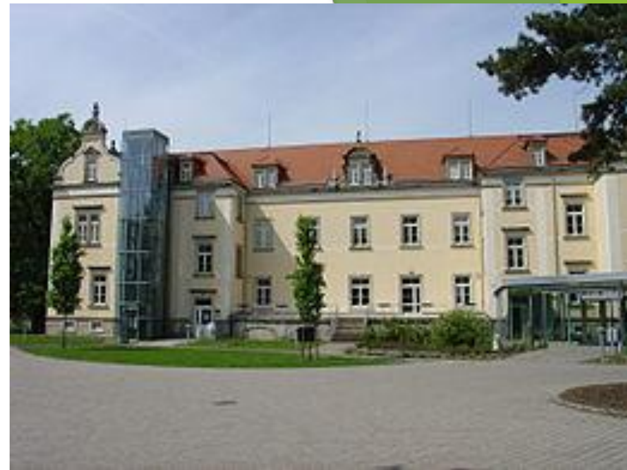
Рисунок 2. В подвале этого здания в местечке Зоннентайн под Пирной (Саксония) были уничтожены в газовых камерах более 13 тысяч душевнобольных и около тысячи узников концлагерей