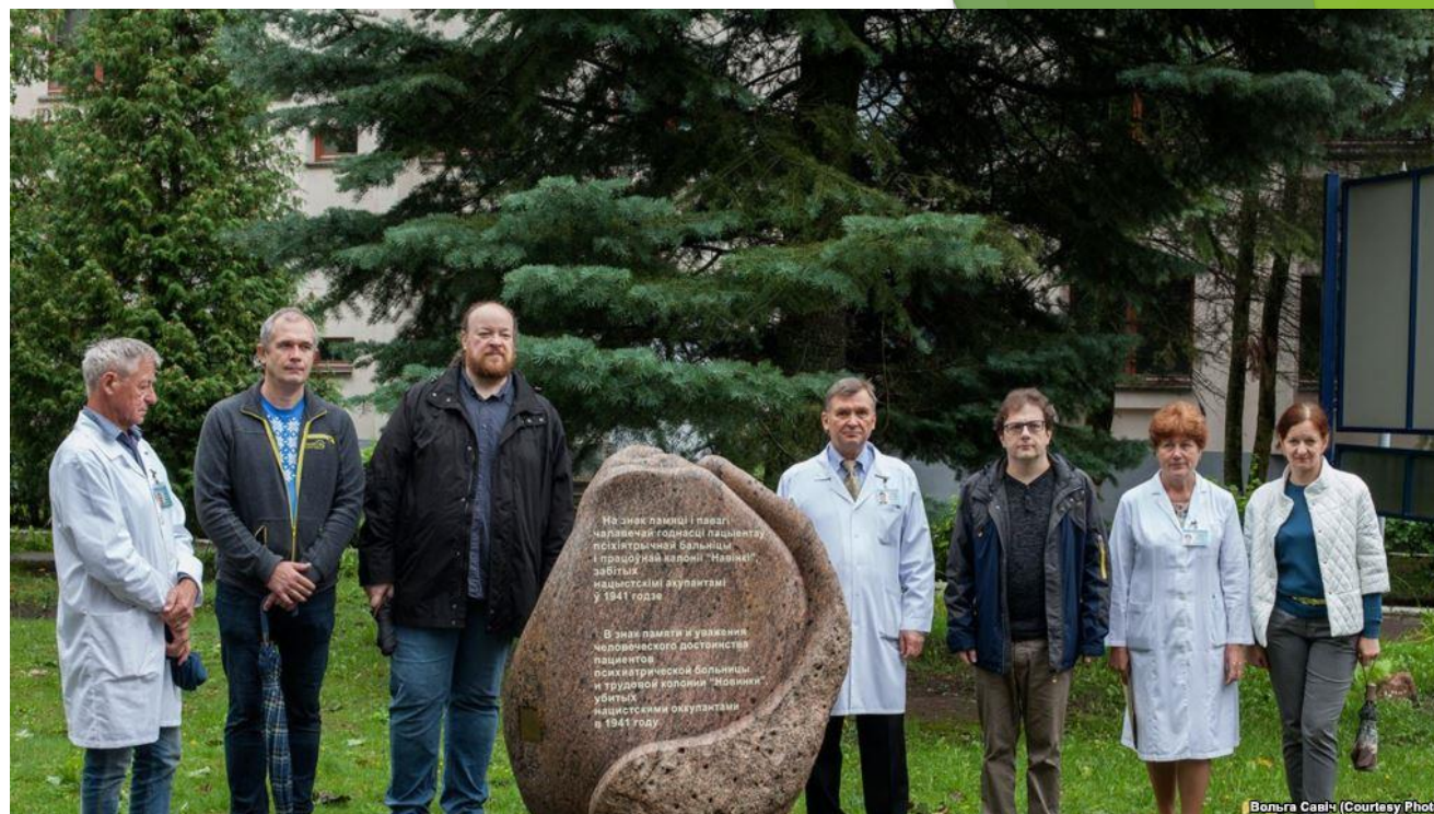
Рисунок 13. Памятник пациентам, убитым в 1941 году в Минской психиатрической больнице. На памятнике размещена надпись "В знак памяти и уважения человеческого достоинства пациентов психиатрической больницы и трудовой колонии "Новинки", убитых нацистскими оккупантами в 1941 году".

▶ В 2017 году памятник был установлен и в Минской психиатрической больнице "Новинки".