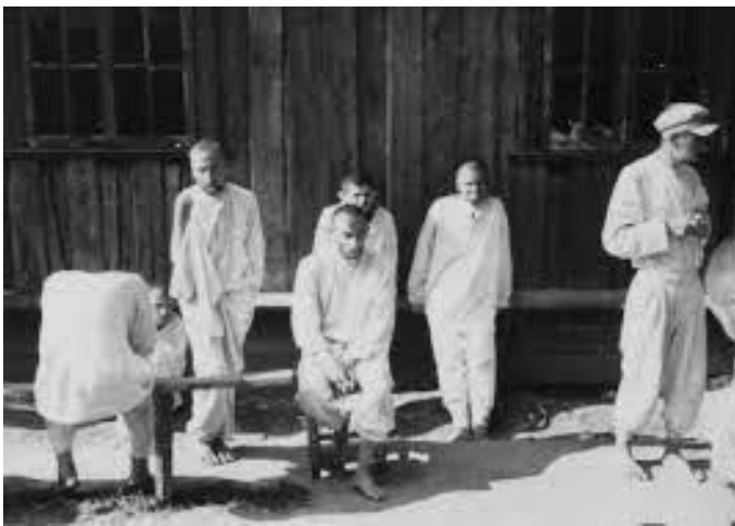
Рисунок 5. Пациенты психиатрической больницы в Новинках 15.08.1941г.