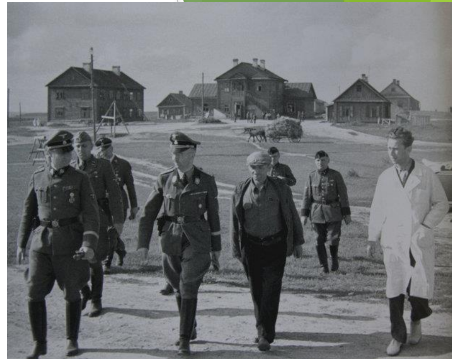
Рисунок 6. Генрих Гиммлер посещает Больницу в Новинках около г. Минска 15.08.1941 года

► Помимо расстрелов, фашистские войска активно применяли и другие, “более гуманные” для психики исполнителей методы убийства больных. Так, 16 сентября 1941 года 300 пациентов Минской психиатрической больницы в Новинках в грубой, жестокой форме загнали в машины и вывезли на станцию Колодищи, где уничтожили с применением взрывчатых веществ. Людям, сопровождавшим машины под угрозой смерти было запрещено распространять какую-либо информацию о произошедших событиях. Позже, в декабре того же года, больница снова была окружена и ещё 100 пациентов были вывезены, о их дальнейшей судьбе ничего неизвестно. Однако метод со взрывчаткой широкого распространения не получил, в отличие от использования газа, который применяли в течение всей оккупации.