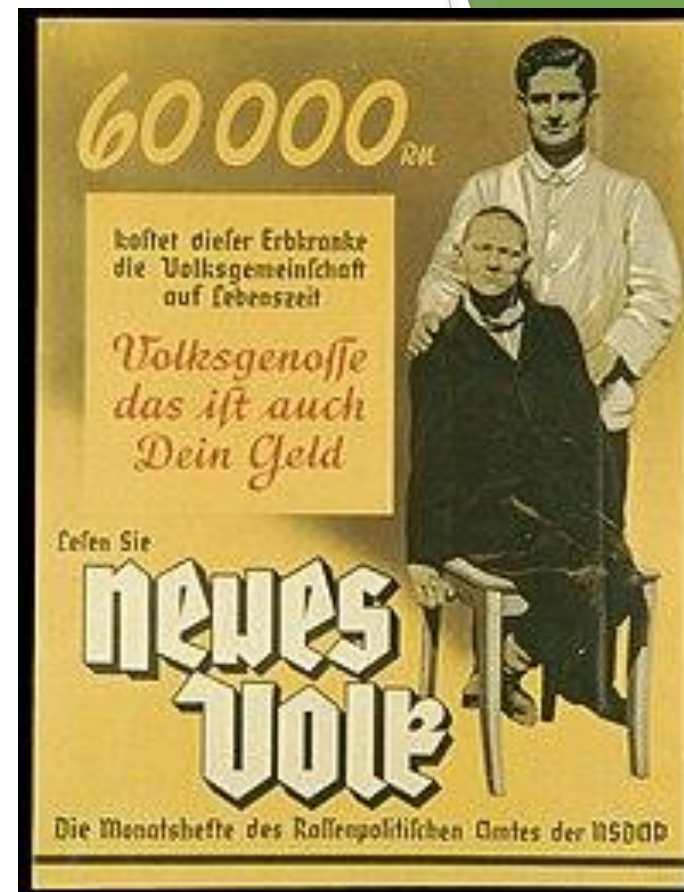
Рисунок 1. Пропаганда убийства так называемых неполноценных людей в нацисткой Германии, на плакате:

► В 20-40-х годах в Германии широкое распространение получили идеи евгеники-лженаучной концепции о наследственном здоровье нации и улучшении её качеств. Одним из её результатов являлось возникновение программы эвтаназии хронических больных, больных с физическими и психическими отклонениями - Т-4 (сокращение от берлинского адреса организации, ответственной за её исполнение: Тиргартен-штрассе, 4). Тогда, в 1930-40-х годах, по программе было стерилизовано или убито колоссальное число немецких граждан, в том числе и детей.