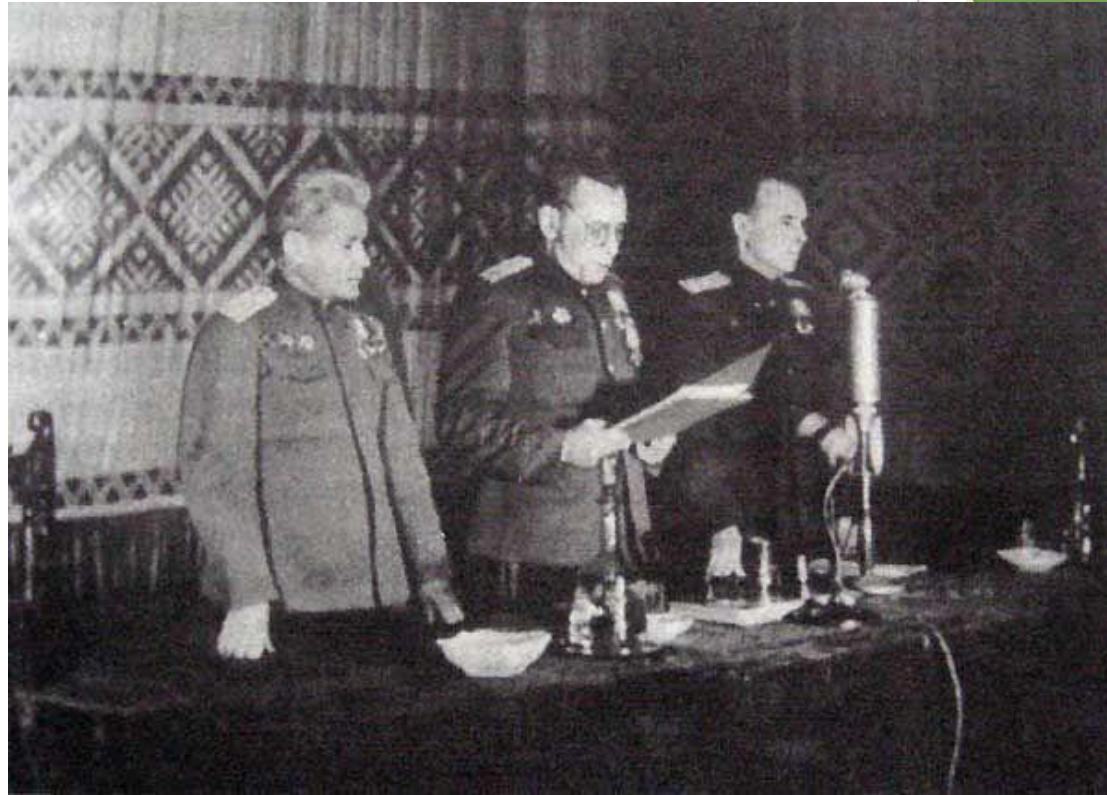
Рисунок 10. Зачитывание приговора по делу о злодеяниях, совершенных нацистскими оккупантами в Белоруссии. 29 января 1946 г.