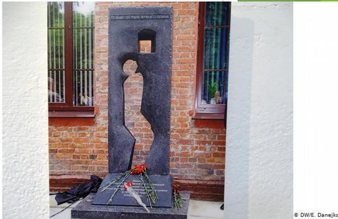
Рисунок 12. Памятник убитым нацистами пациентам Могилевской психиатрической больницы

► В 2009 году в ходе совместной работы белорусских и немецких врачей, историков появился первый памятник уничтоженным пациентам психиатрических клиник на территории всего бывшего советского союза.