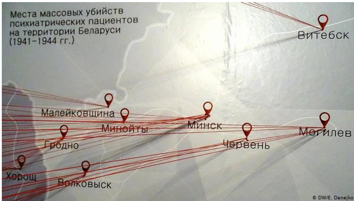
Рисунок 4. Места массовых убийств психиатрических Пациентов на территории Беларуси