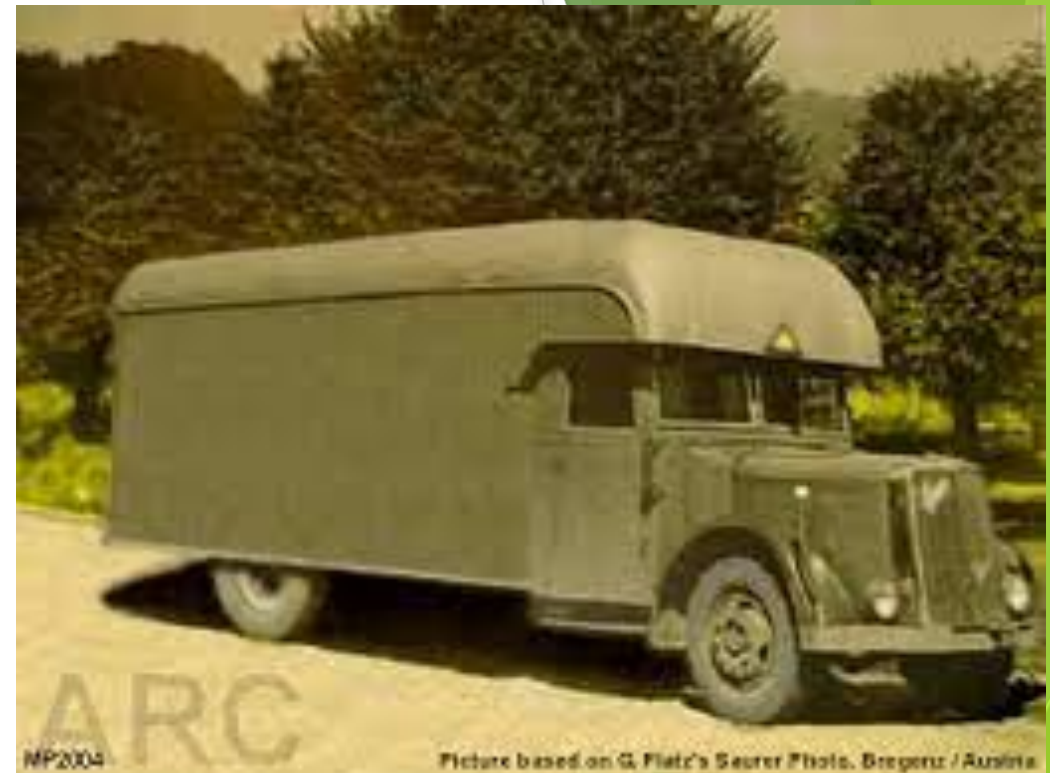
Рисунок 8. Душегубка(нем. Gaswagen-Газовый автомобиль)-автофургон с герметичным кузовом для уничтожения людей путём удушения выхлопными газами работающего Мотора.