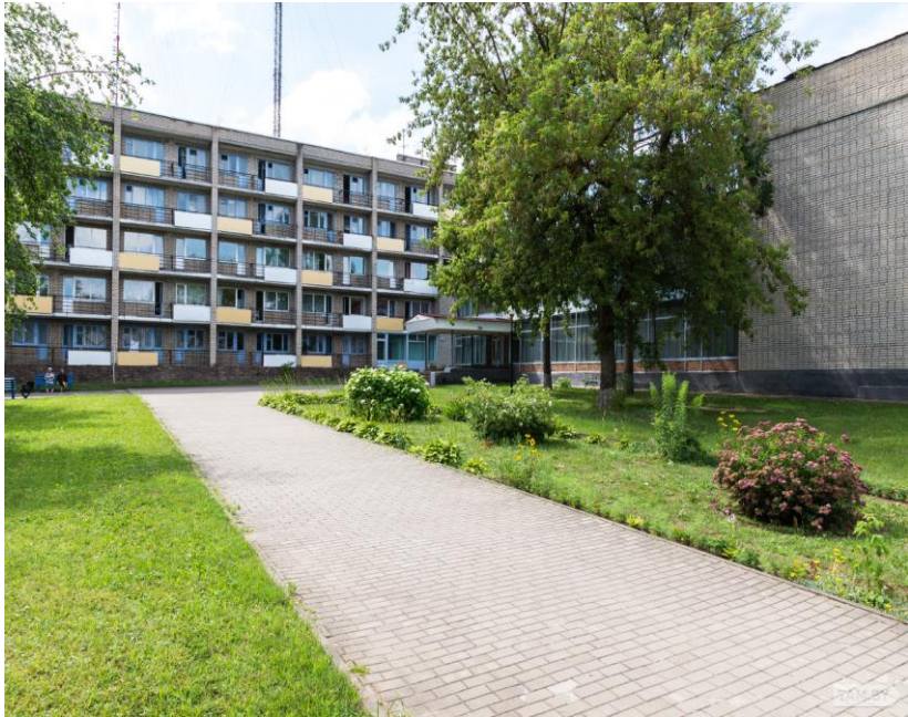
Рисунок 7. Могилёвская психиатрическая больница (современное состояние)