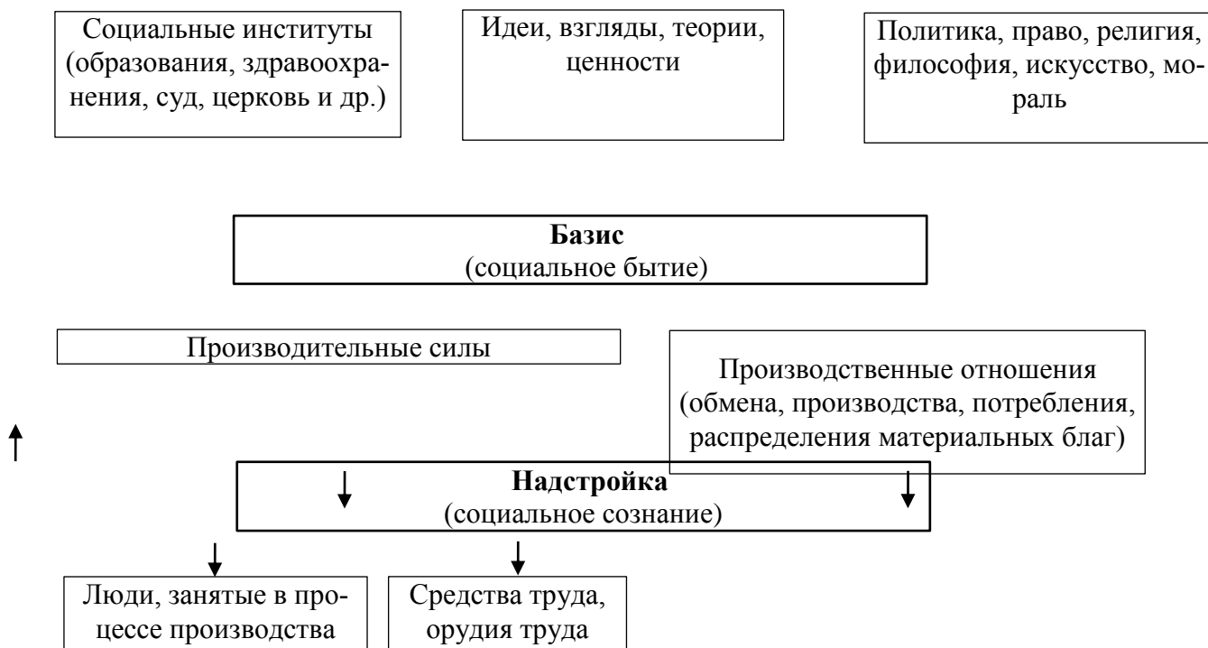
Рис. 3. Модель общества в марксизме

Общество развивается по определенным закономерностям (прежде всего, экономическим), а способ производства материальных благ определяет в итоге уровень развития общества. Вся история в марксизме — закономерный естественно-исторический процесс последовательной смены одних общественно-исторических формаций другими на основе изменения способов производства. Общественно-экономическая формация — это общество на определенном этапе исторического развития со свойственными ему базисом и надстройкой. Маркс и Энгельс выделяют пять общественно-экономических формаций: первобытнообщинную, рабовладельческую, феодальную, капиталистическую и коммунистическую .