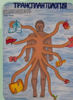
«Трансплантология» Приходько Ксения, Кулеш Таисия