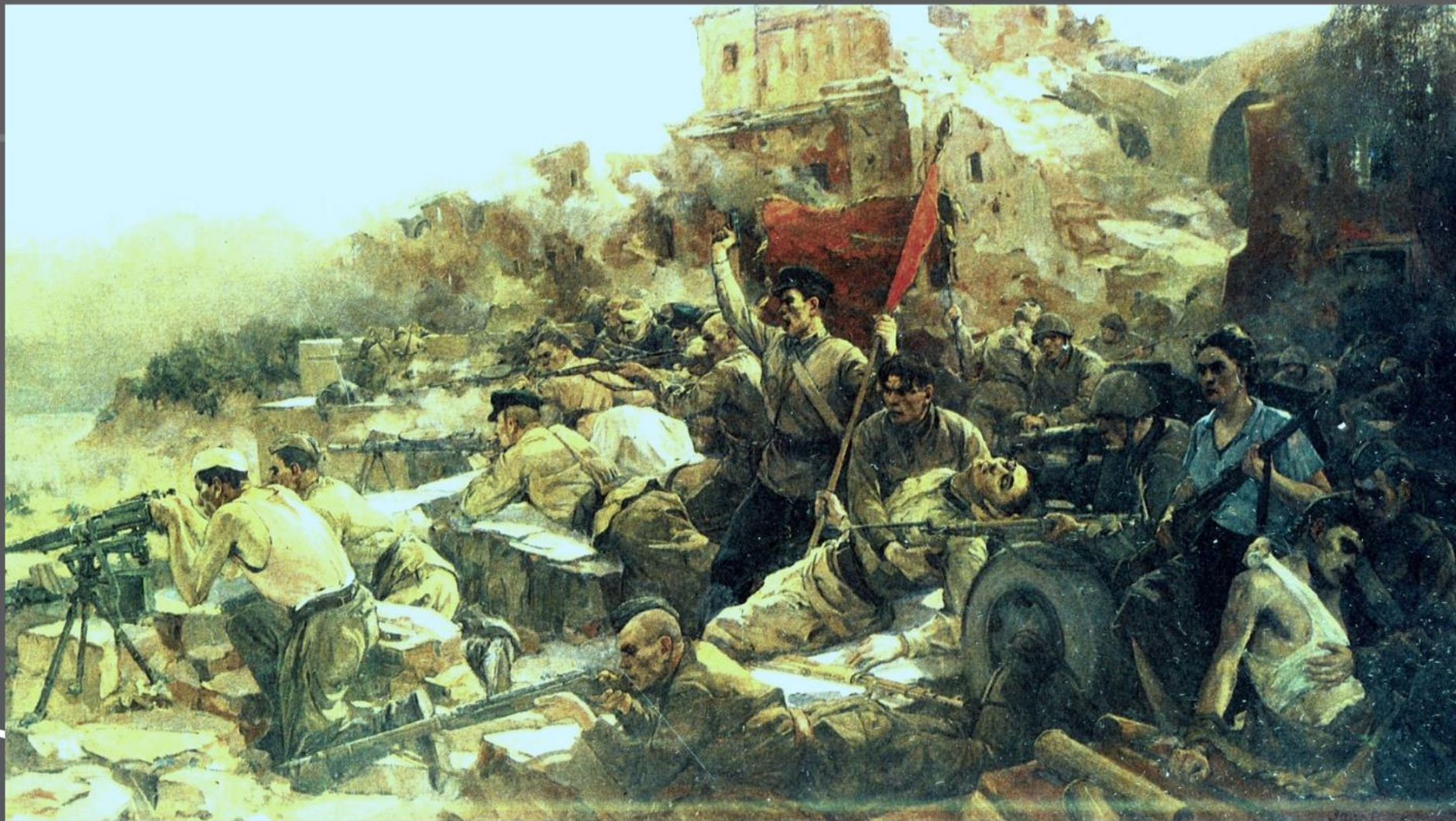
Картина 1950 год Оборона Брестской крепости в 1941 году.