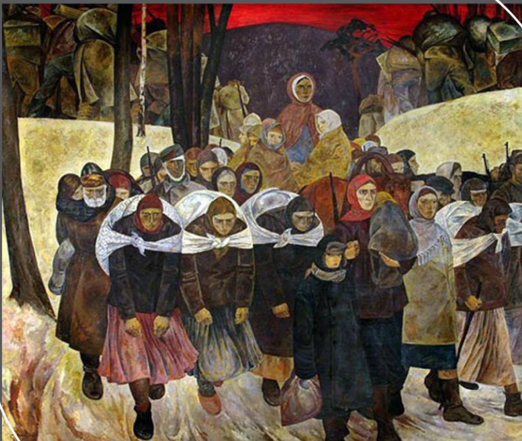
Картина «Витебские ворота»

Михаил Андреевич Савицкий 1922-2010 родился 18 февраля 1922 года в деревне Звенячи Толочинского района Витебской области.