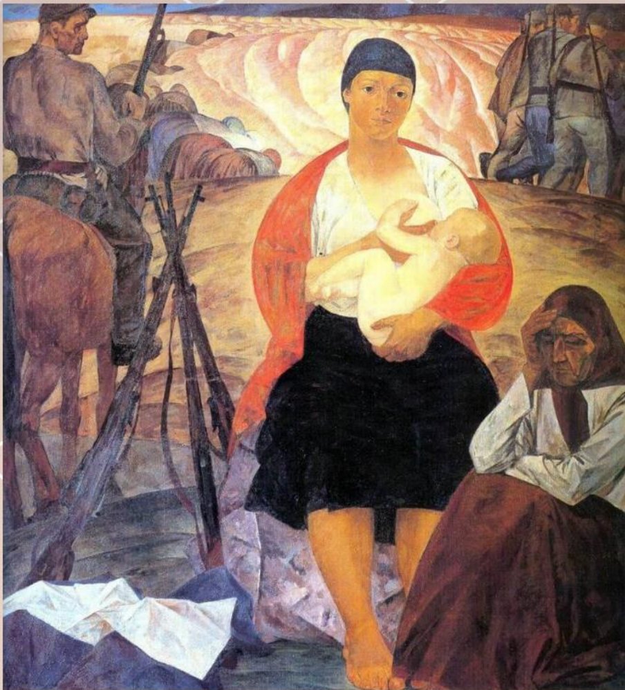
Картина «Партизанская мадонна»

В картине «Партизанская Мадонна» художник обращается к вечному символу жизни – материнству. Глядя на работу невольно на память приходит знаменитая рафаэлевская «Сикстинская мадонна», но эта ближе и роднее. Скорее всего потому, что понимаешь — на ней изображены реальные люди, те, с которыми общались наши деды и прадеды.