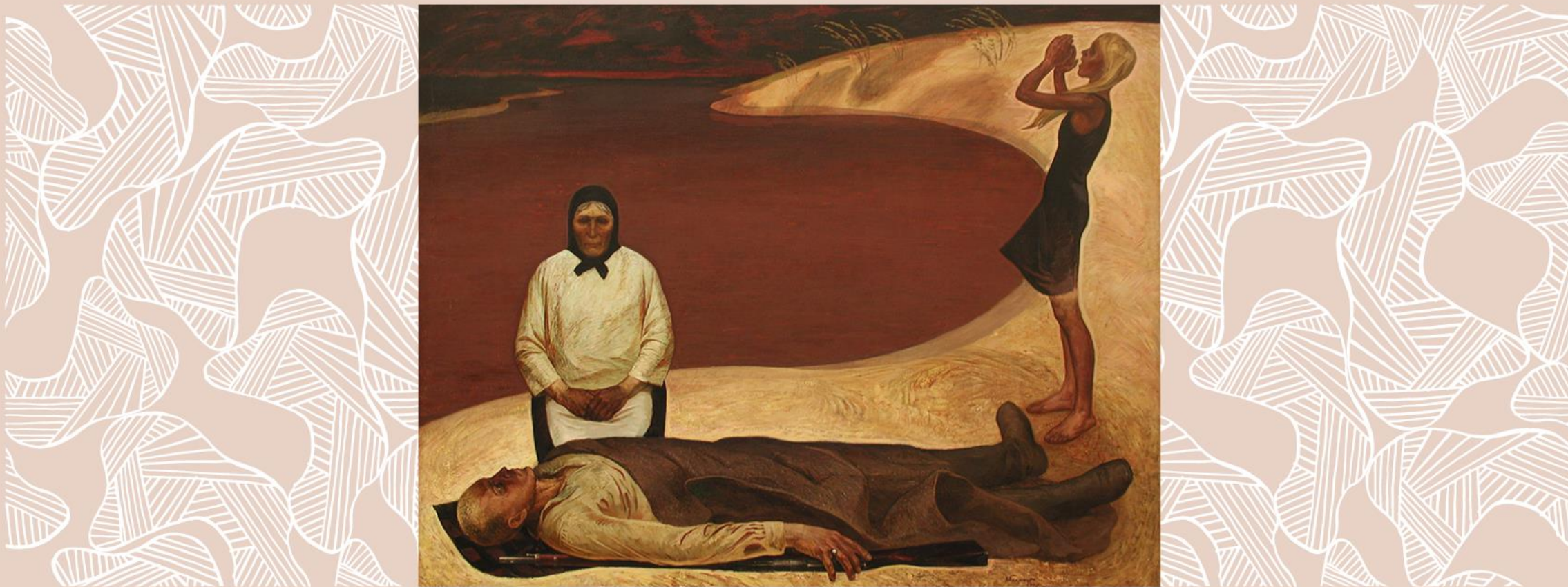
Картина «1941 год. Над Припятью» Виктор Громько

Искусство имеет большое влияние на формирование патриотических взглядов молодежи, на формирование традиционных ценностей. Искусство воздействует на разум и чувства людей, способствует выработке у них жизненных ориентаций, установок и мотивов деятельности. Искусство также помогает укреплять связь с историей и культурой своего народа, своей Родины.