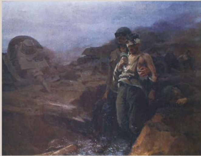
Картина "Стояли насмерть"