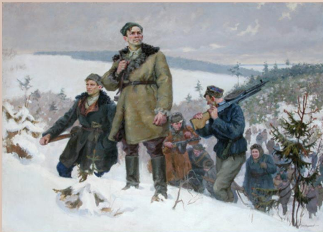
Картина 1948 год "За родную Белоруссию"