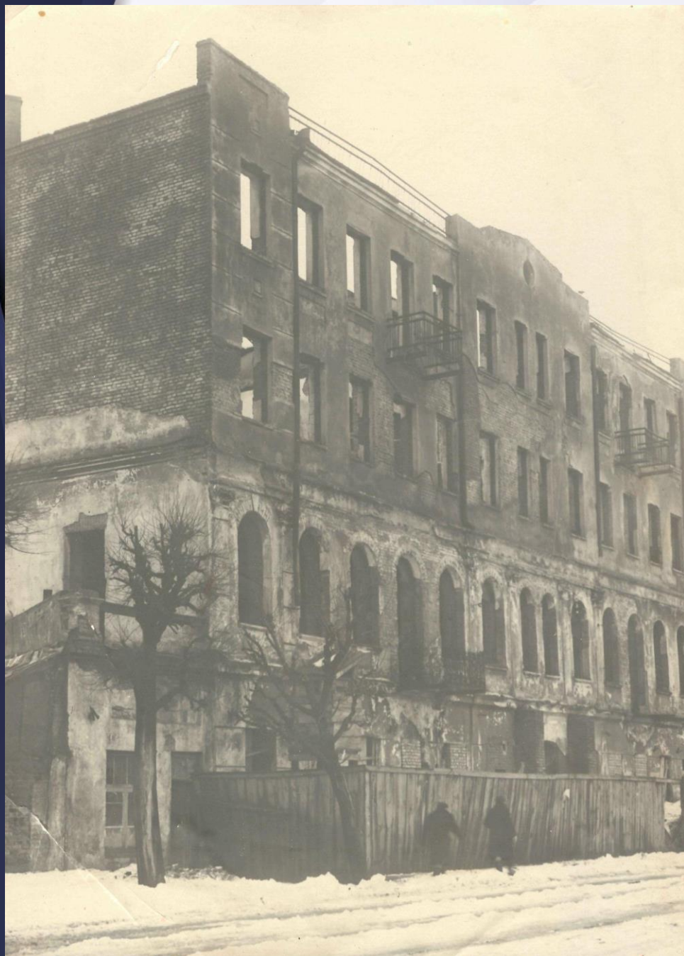
Общежитие Белорусского медицинского института на ул. Ленинградская д. 6, разрушенное в годы войны. 1944 г.