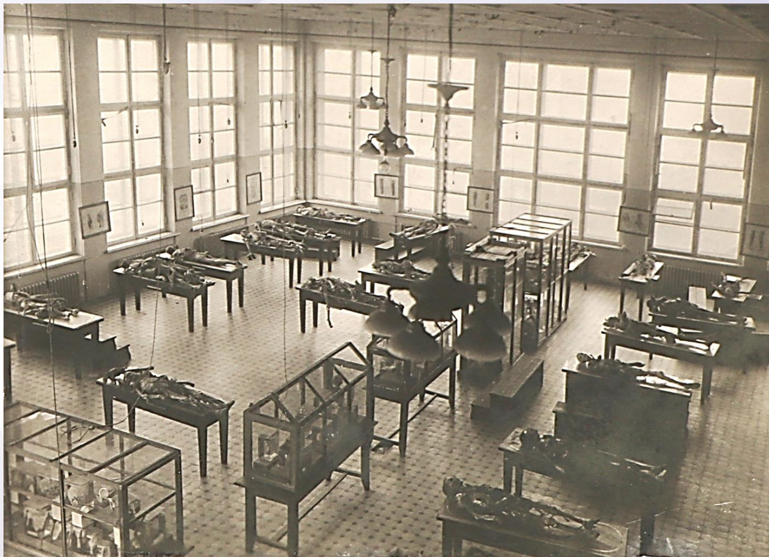
Большой анатомический зал Белорусского медицинского института. 1930-е годы