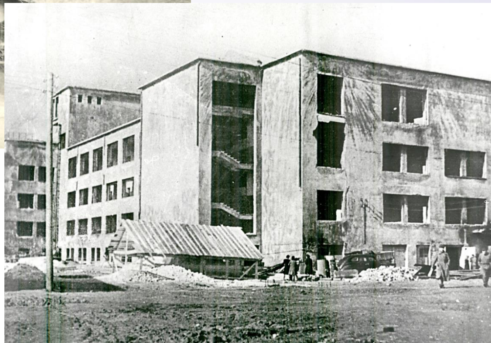
Здания Белорусского медицинского института, пострадавшие во время войны. Минск, 1944/1945 гг.