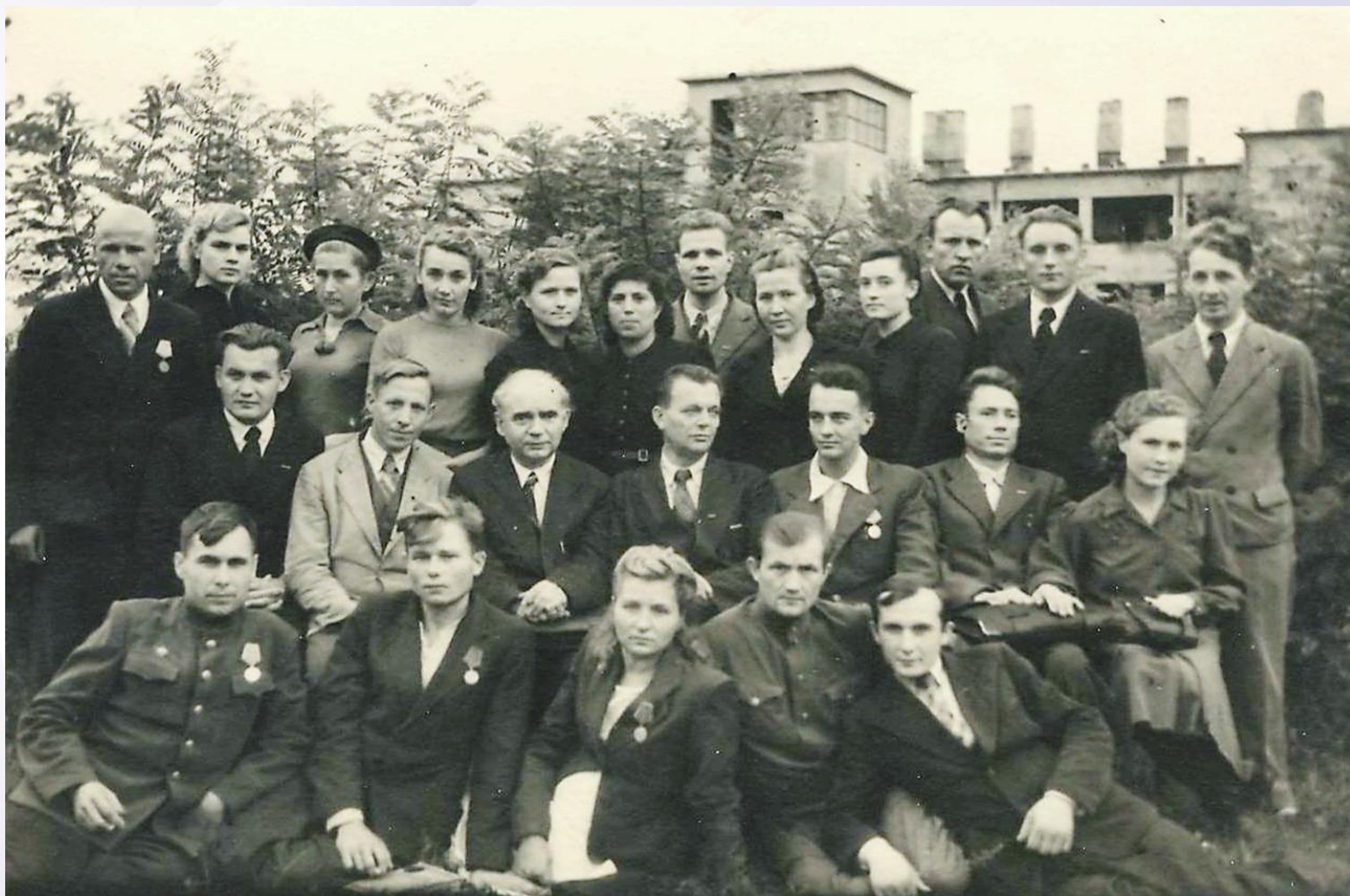
Выпускники Минского медицинского института – участники партизанского движения. Минск, 1945 г.