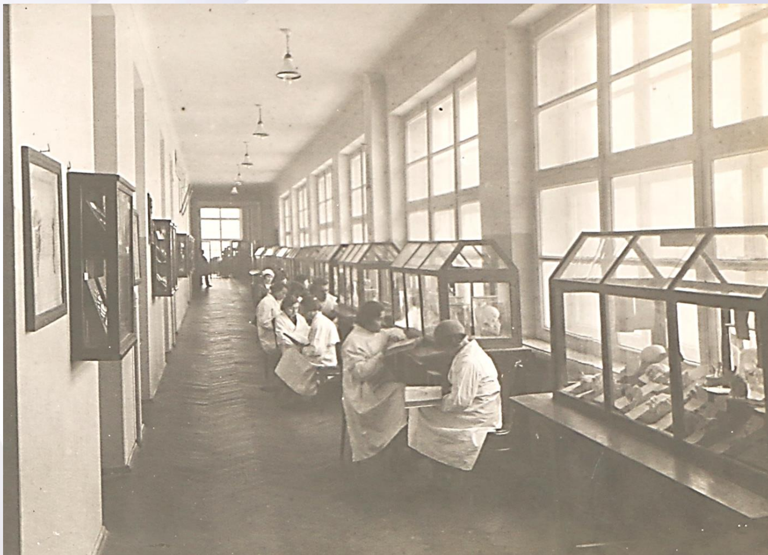
Анатомический музей Белорусского медицинского института. 1930-е годы.