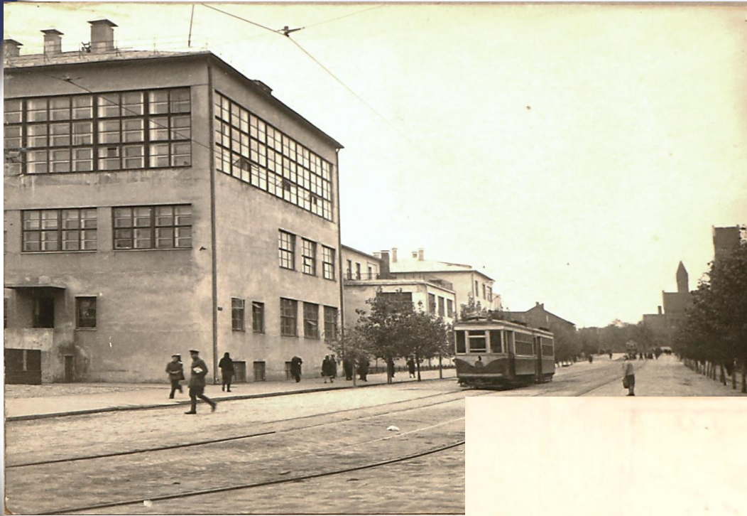
Белорусский медицинский институт. 1930-е гг.