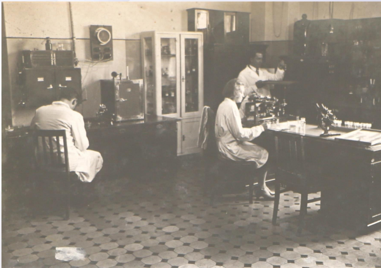
Морфологическая лаборатория кафедры нормальной анатомии. 1930-е годы.