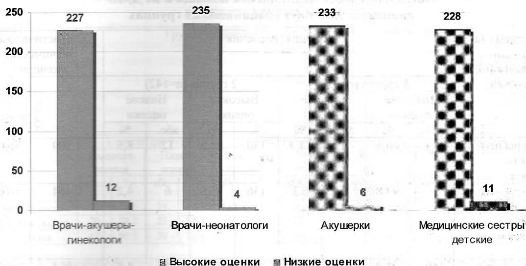
Рис. 1. Оценки респондентами оказания медицинской помощи медицинскими работниками в КРДМО

29,13 лет [95% ДИ 28,04–29,51], в группе 2 – 30,39 лет [95% ДИ 30,23–31,26] ( p > 0,05 ). Статистически значимые различия респондентов в двух сравниваемых группах по месту проживания (город/село) и семейному положению не выявлены ( p > 0,05 ).