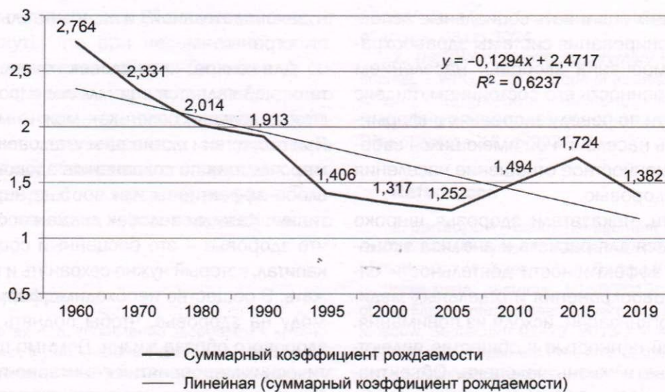
Рисунок 2. Динамика суммарного коэффициента рождаемости в Республике Беларусь (1960–2019 гг.)

и механизма эффективного их использования для решения задач повышения качества и доступности медицинской помощи, достижения конкретных показателей здоровья населения. В отличие от прогноза план определяет конкретные мероприятия, реализация которых обеспечивает достижение прогнозных показателей. План обязателен для исполнения и должен быть обеспечен достаточными ресурсами.