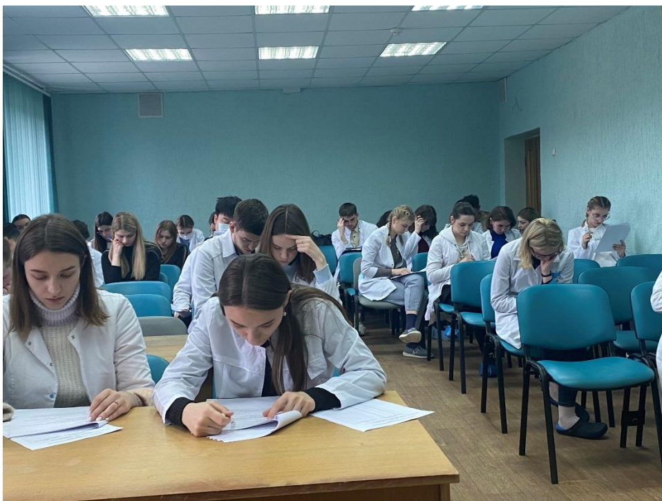
Идет напряженная работа

За ходом проведения Олимпиады наблюдала оценочная комиссия, состоящая из представителей 1-й и 2-й кафедр внутренних болезней, а также кафедры кардиологии и внутренних болезней. В этом году лидер был очевиден. Но развернулась нешуточная борьба за 2 и 3 места. Таким образом, призовые места достались пяти студентам.