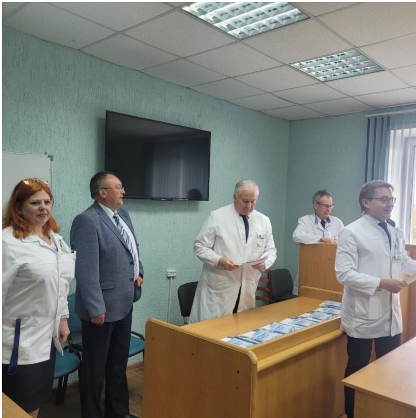
Оглашение результатов и награждение победителей!