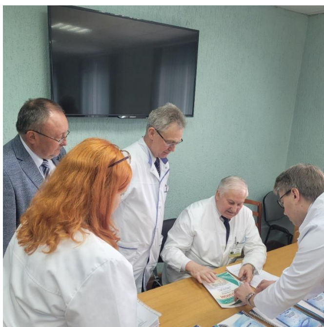
Определение победителя и лауреатов – дело непростое...

За ходом проведения Олимпиады наблюдала оценочная комиссия, состоящая из представителей 1-й и 2-й кафедр внутренних болезней, а также кафедры кардиологии и внутренних болезней. В этом году лидер был очевиден. Но развернулась нешуточная борьба за 2 и 3 места. Таким образом, призовые места достались пяти студентам.