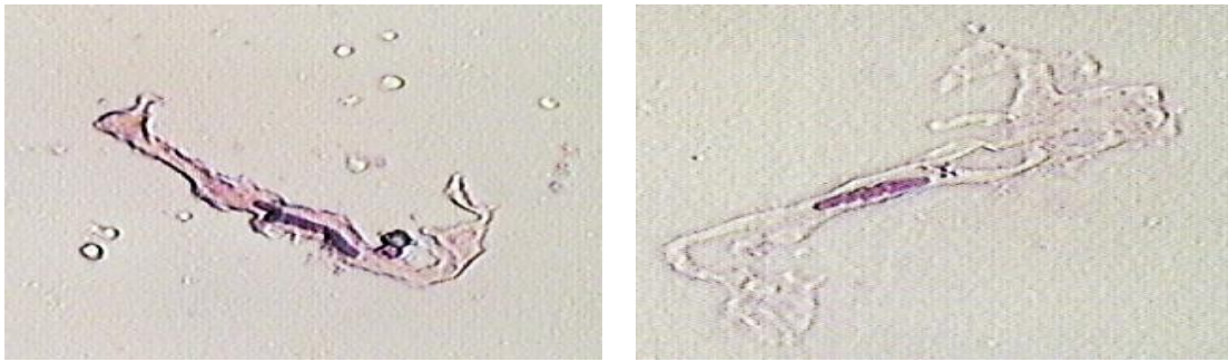
Рис. 1. Клеточный состав стенки брюшного отдела аорты человека. Окраска азур-эозин 2, об. 40×

Гладкие миоциты сосудов являются гетерогенной клеточной популяцией [3, 4]. В соответствие с клеточным фенотипом и функцией выделяют две основные клеточные линии: сократительные (или контрактильные) и синтетические ГМК сосудов. Сократительные клетки обеспечивают тургор сосудов и механические свойства сосудистой стенки в целом. Клетки синтетического типа способны к пролиферации и участвуют в синтезе компонентов экстрацеллюлярного матрикса.