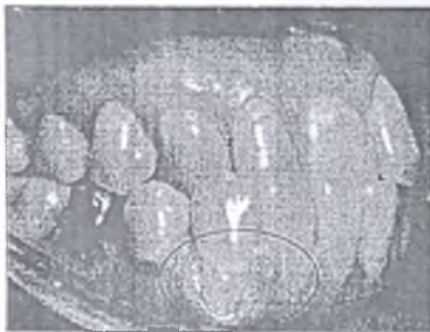
Рис. 2. Клиническая картина пациента с анатомической генерализованной рецессией десны