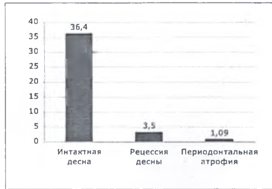
Рис. 5. Средние показатели интенсивности микроциркуляции крови в десне в трех группах,