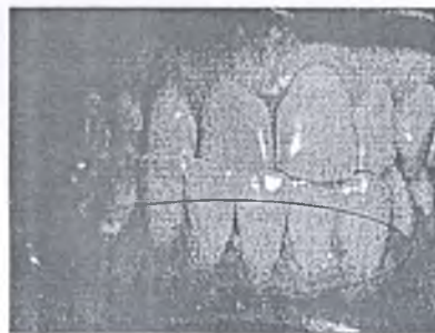
Рис. 3. Контраст интенсивности микроциркуляции десны пациента с рецессией десны