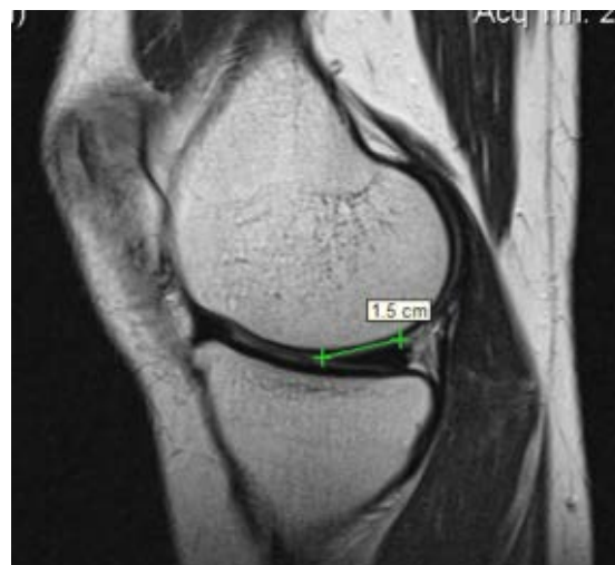
Рисунок 2. – Длина медиального мениска (указана стрелками) МРТ-скан

Морфометрические характеристики структур коленного сустава, установленные в настоящем исследовании, представлены в таблице.