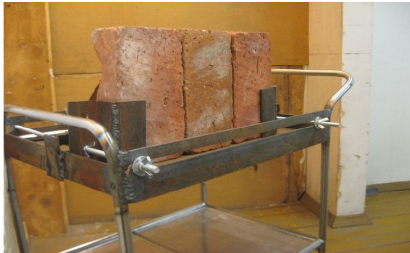
Установка для моделирования рикошета пули в экспериментальных условиях (с установленной и фиксированной преградой – кирпич строительный глиняный плотный марки 100).