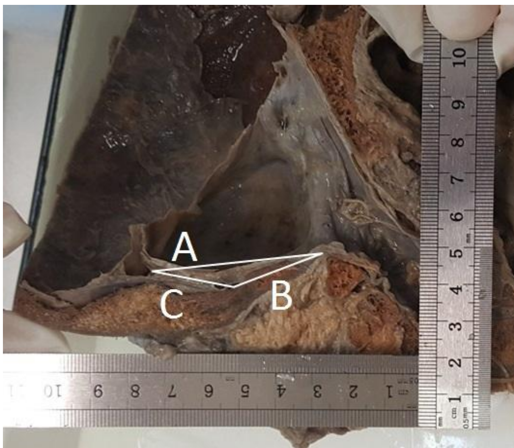
Рис. 1. Для определения угла изгиба затылочного синуса используется треугольник с вершинами в начале, местах расхождения и максимального изгиба sinus occipitalis.

где a, b и c – длины соответствующих сторон треугольника (см. рис. 1) растёт с увеличением расчетного значения угла).