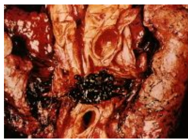
Рис. 2. ТЭЛА

Венозный тромбоз является следствием многочисленных заболеваний и состояний, нарушающих нормальное состояние коагуляции и ведущих к образованию тромба в различных отделах венозной системы. Еще в 1854 г. Р. Вирхов описал основные механизмы внутрисосудистого образования тромбов – классическую триаду, включающую изменение крови (состояние гиперкоагуляции), травму стенки сосуда (повреждение эндотелия), замедление тока крови (стаз). Однако, несмотря на кажущуюся простоту изложенного, до настоящего времени отсутствуют ответы на самые, казалось бы, элементарные вопросы патогенеза. Тромбы чаще всего локализуются первично в синусах венозных клапанов и распространяются по ходу вены. Различают две основные формы – тромбофлебит и флеботромбоз.