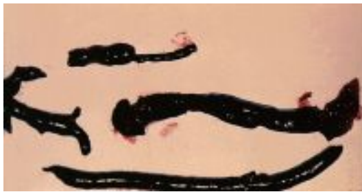
Рис. 1. Венозные тромбы.