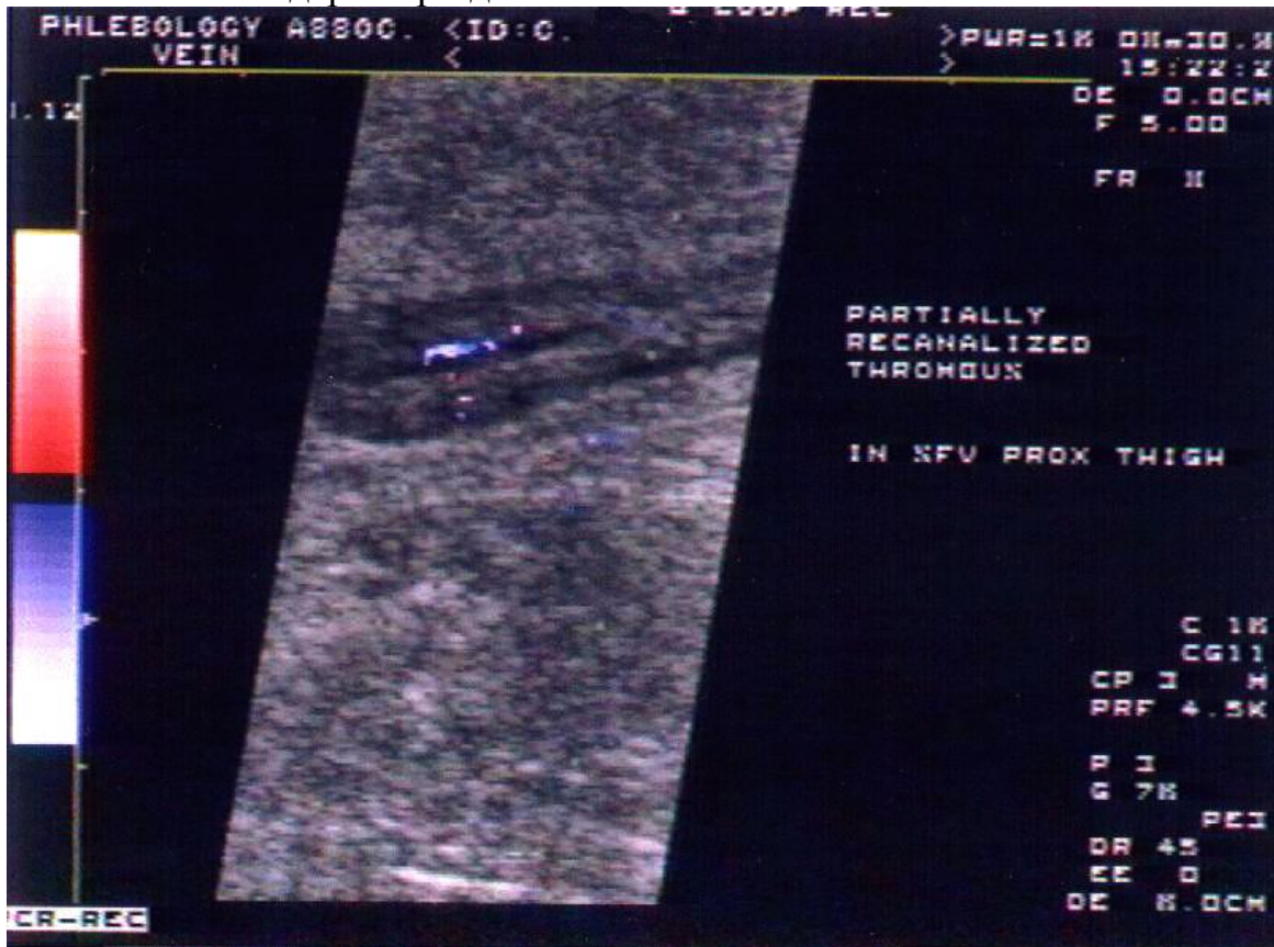
Рис. 4. Ультразвуковое цветное дуплексное сканирование.

УЦДС является широко используемым неинвазивным способом диагностики и имеет ряд преимуществ; применяясь у неподвижных больных, может выполняться неоднократно. Установление диагноза ВТ основано на принципиальных отличиях проходимой вены от вены тромбированной и определении границы этих отличий. Признаки тромбоза при ультразвуковом сканировании – это увеличение диаметра вены, невозможность сда-