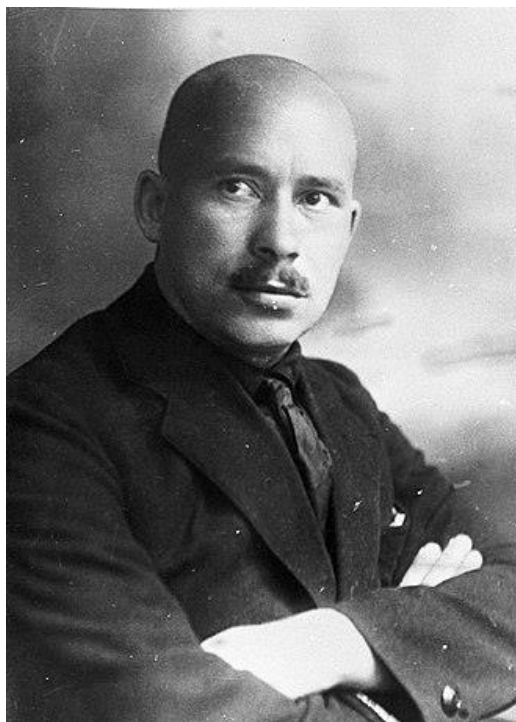
Александр Григорьевич Червяков