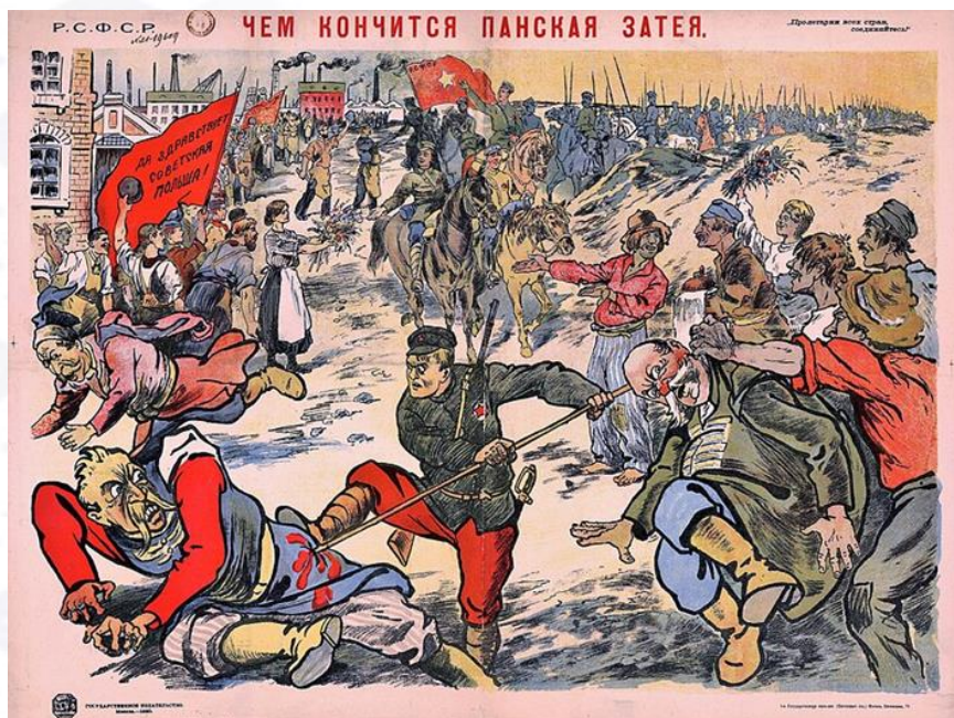
«Чем кончится панская затея» Советский плакат 1920г.

Документ, утверждавший независимость Беларуси на основе воли его трудового народа, подписали Компартия Литвы и Беларуси, Белорусская коммунистическая организация, Бунд и Центральное бюро профсоюзов. Все постановления польских властей отменялись, «Наивысшая Рада» БНР объявлялась низложенной и подлежащей суду рабочих и крестьян. Частная собственность на землю упразднялась, право на пользование землей давала только ее обработка своим трудом. ССРБ была восстановлена только в границах 6 уездов Минской губернии.