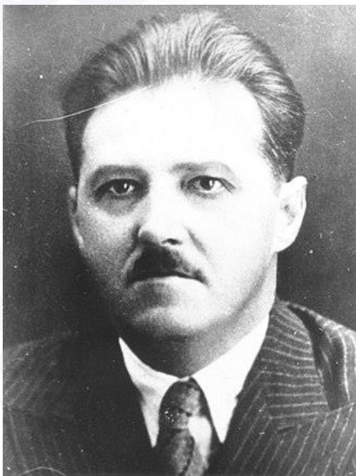
Вильгельм Георгиевич Кнорин

Среди подписавших Декларацию о независимости Советской Социалистической Республики Белоруссии были Вильгельм Кнорин, Александр Червяков, Всеволод Игнатовский - впоследствии видные партийные, государственные и общественные деятели, в честь которых названы улицы Минска.