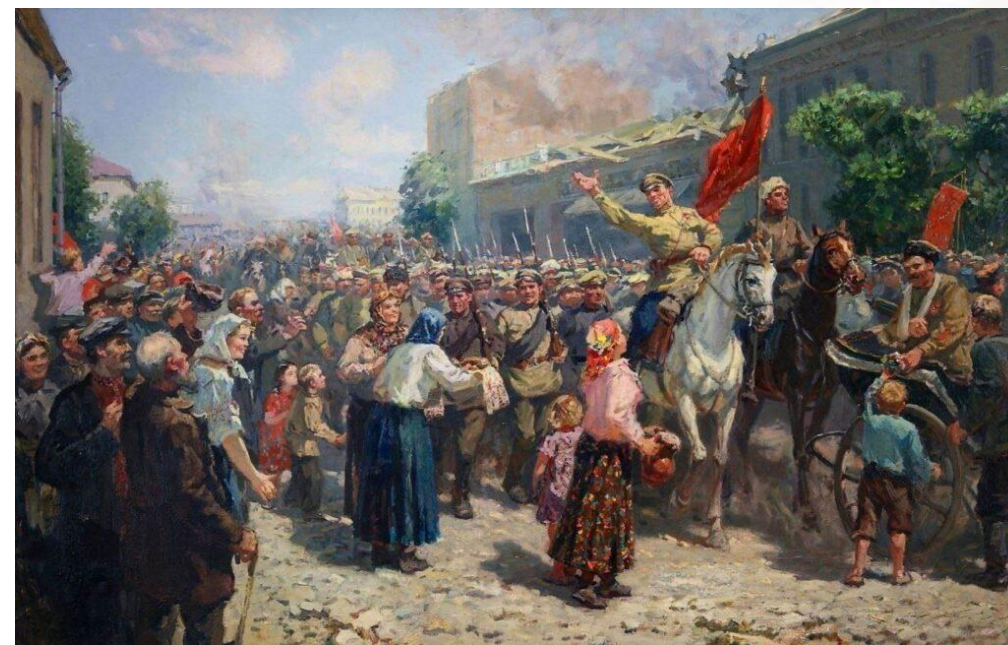
«Жители Минска встречают Красную армию». Картина художника Г. Прокопинского