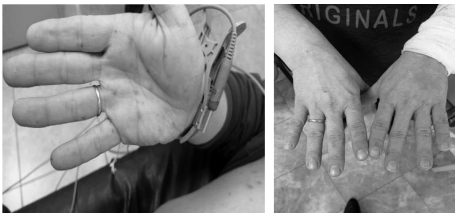
Рис. 4. Уменьшение сыпи у пациента при выписке

(результат отрицательный), антитела к ВИЧ от 16.01.2023 (не обнаружены), сифилис RPR-тест от 17.01.2023 (отрицательный), посев крови на стерильность и чувствительность к антибиотикам от 17.01.2023 (рост микрофлоры в аэробных условиях не получен).