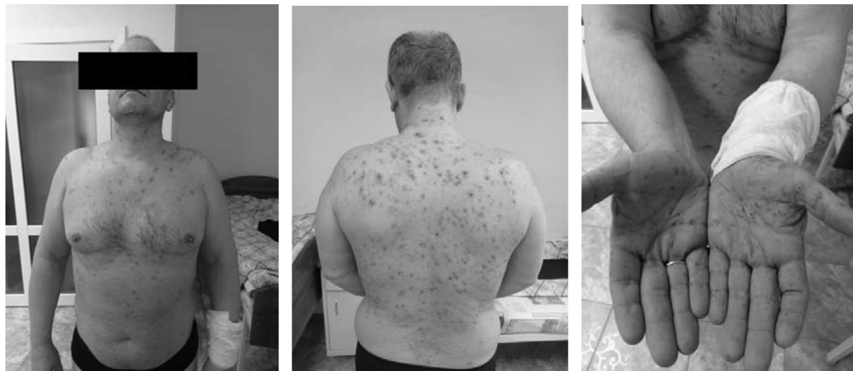
Рис. 1. Папуло-пустулезный характер высыпаний у пациента К. при обращении в стационар

изменений. Диагноз при поступлении – распространенная пиодермия.