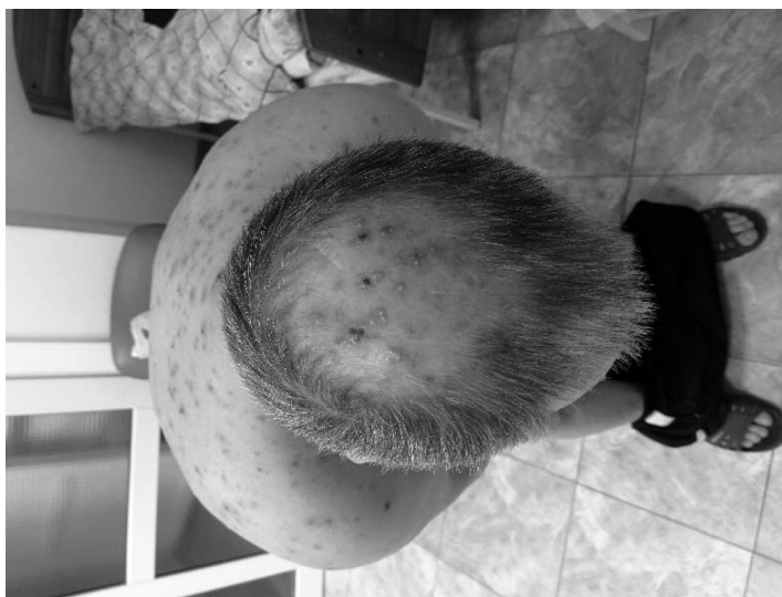
Рис. 3. Высыпания у пациента К. через неделю после начала лечения

С целью исключения вторичной бактериальной инфекции определялся прокальцитонин, уровень которого составил 0,1 нг/л. (11.01.2023).