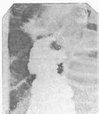
Рис.1. На рентгенограмме тугое заполнение бариевой взвесью нисходящего отдела толстой кишки до циркулярного сужения

Считает себя больным около 6 месяцев, когда периодически стали беспокоить боли и вздутие живота. За медицинской помощью не обращался. Стационарно не обследовался и не лечился. 13.09.07 г. на фоне хорошего самочувствия появились боли и тяжесть в эпигастрии, отсутствие аппетита. Обратился за медицинской помощью в медицинский пункт части в/ч 5522. Направлен на консультацию к