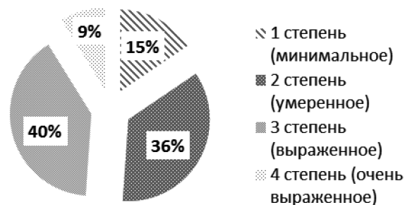
Рис. 1. Распределение выраженности утомления у пациентов группы обследования по результатам анкетирования

По результатам SPPB-теста средние показатели в подгруппе с ХСН ФК I-II продемонстрировали среднюю или даже высокую физическую активность, в то время как в подгруппе пациентов с ХСН ФК III-IV – низкую (таблица 4).