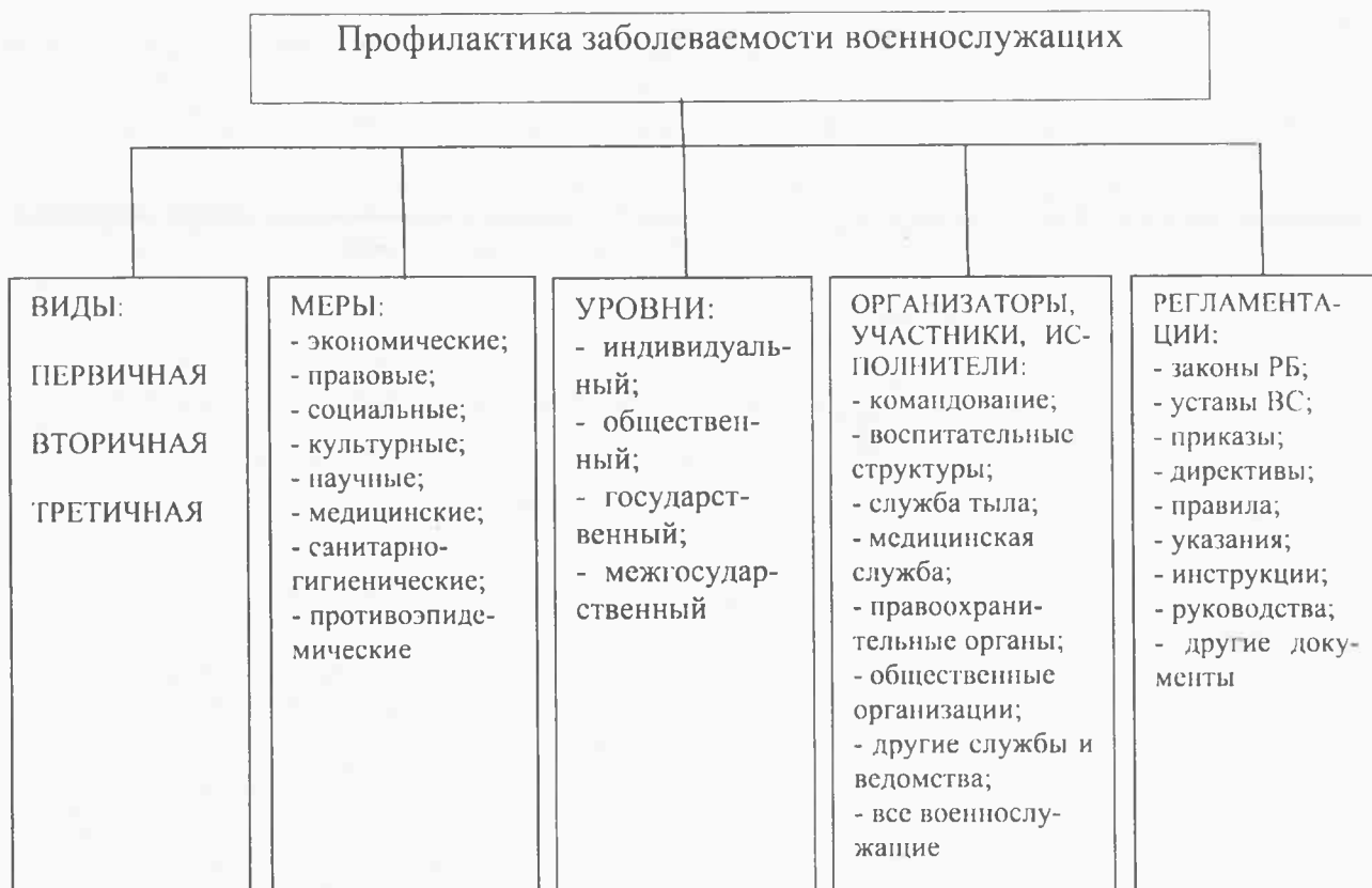
Схема 1. Профилактика заболеваемости военнослужащих

цели, следует хорошо знать причины возникновения болезней и преждевременного изнашивания организма. В связи с тем, что подавляющее большинство этих причин являются следствием взаимодействия организма с факторами окружающей среды, предметом исследования гигиены представлены закономерностями влияния окружающей среды на здоровье людей, а объектами – человек и окружающая среда. К сожалению, до настоящего времени в своей практической деятельности военные гигиенисты уделяют основное внимание изучению и оценке факторов окружающей среды, в меньшей степени или практически не занимаются оценкой состояния здоровья военнослужащих, уровнем их физической и функциональной подготовленности.