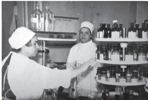
Фото 14. Работники аптеки госпиталя