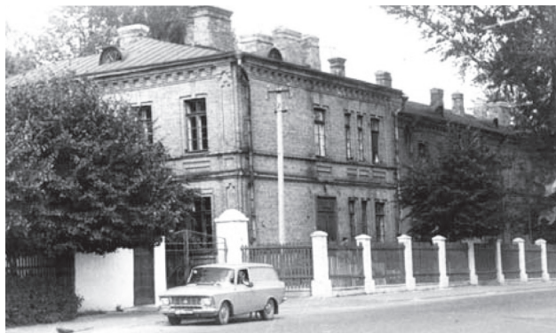
Фото 1. Хирургическое отделение 1960 г.