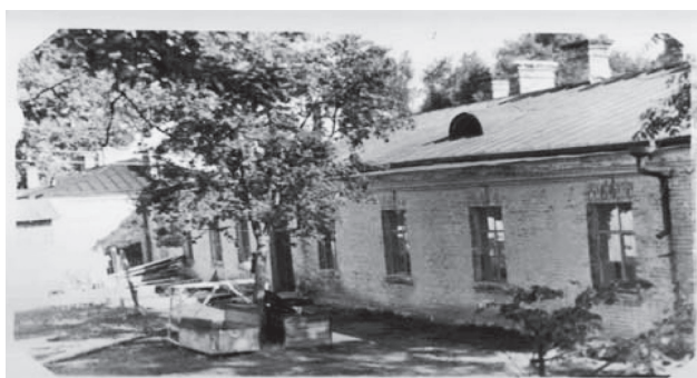
Фото 5. Инфекционное отделение 1960 г.