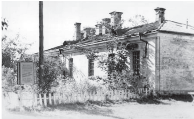
Фото 9. Физиотерапевтическое отделение 1960 г.