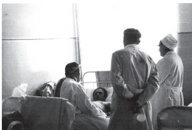
Фото 12. Обход больных в стационаре

В госпитальной поликлинике осуществлялся амбулаторный прием и консультирование врачами специалистами госпиталя военнослужащих срочной службы, офицеров, прапорщиков (в том числе членов их семей), а также ветеранов ВС, Великой Отечественной войны 1941–1945 гг., военных пенсионеров (Фото 11 и 12).