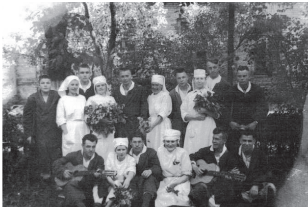
Фото 13. Средний медицинский персонал госпиталя со своими пациентами, 1960 г.