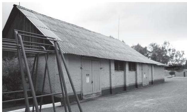
Фото 16. Складские помещения госпиталя 2014 г.