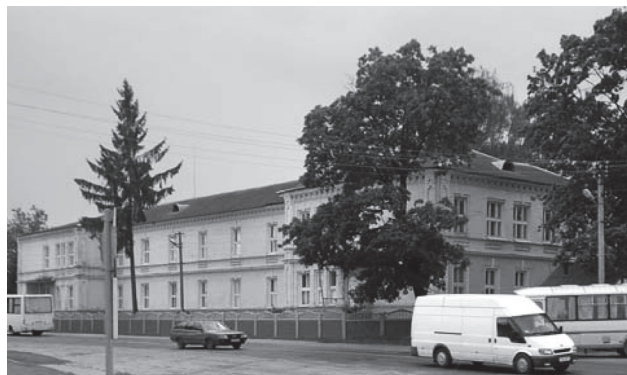
Фото 2. Хирургическое отделение 2014 г.