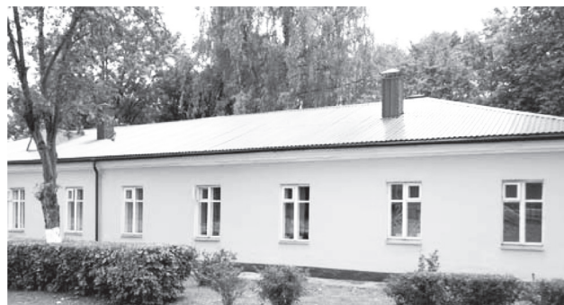
Фото 6. Инфекционное отделение 2014 г.