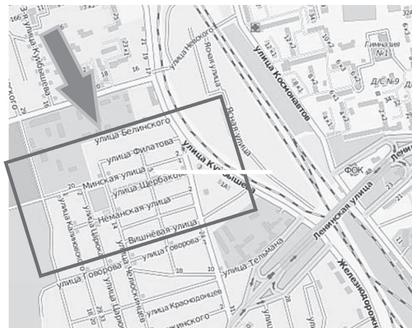
Рис. 2. Фрагмент карты г. Лиды 2014 г. Место расположения зданий бывшего Лидского № 671 ВГ

К некоечным лечебно-диагностическим отделениям относились: приемное отделение (Фото 7 и 8) и стационар для дневного (амбулаторного лечения) пребывания больных с физиотерапевтическим отделением (Фото 9 и 10).