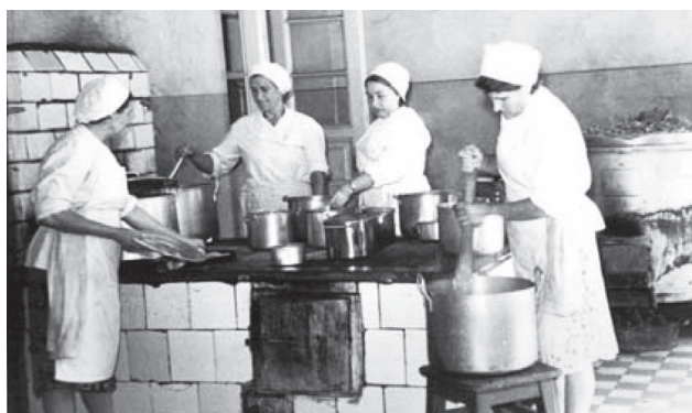
Фото 15. Работники кухни госпиталя за приготовлением пищи