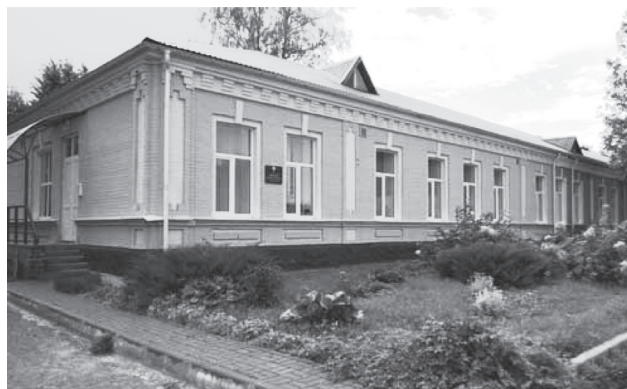
Фото 4. Терапевтическое отделение 2014 г.