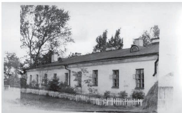
Фото 3. Терапевтическое отделение 1960 г.