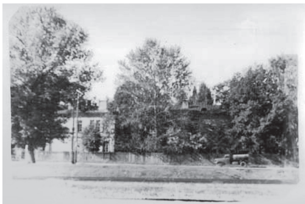
Фото 7. Приемное отделение 1960 г.