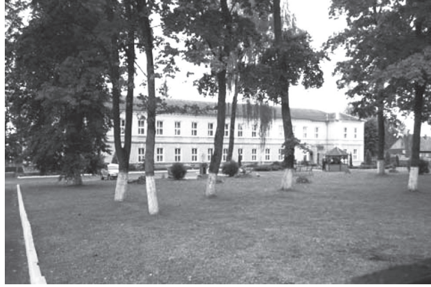
Фото 8. Приемное отделение 2014 г.