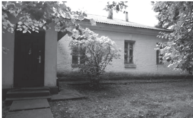
Фото 10. Физиотерапевтическое отделение 2014 г.