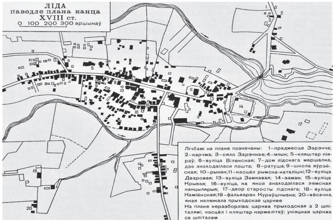
Рис. 1. Фрагмент плана Лиды 1795 г. Улица Замковая (№ 13), ул. Дворная (№ 12)

Позднее в 1813 г. в Лиде был организован военный госпиталь при военной дороге из Минска в Гродно 1 .