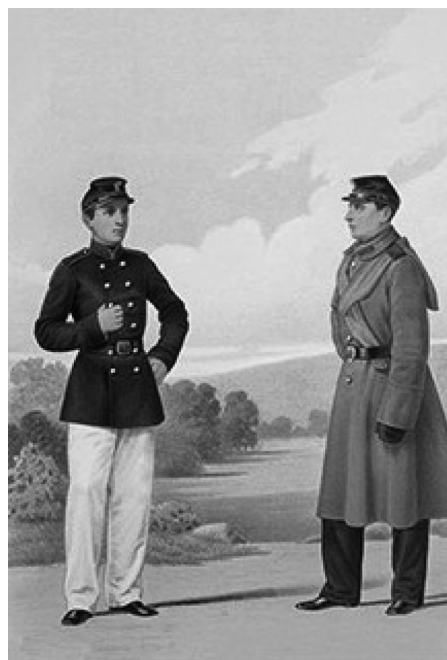
Рис. 1. Воспитанники ВФШ в форме 1869 г.

Школы этого типа, конечно, не могли выполнить такой задачи, так как в лучшем случае они готовили лишь военнoслужаших, усваивавших технику фельдшерского дела, поэтому в отношении ВФШ типа 1838 г. вслед за реформой других военно-учебных заведений в 1869 г. была проведена собственная реформа. Устройство ВФШ типа 1869 г. было основано, с небольшими изменениями, на «Положении» от 26.04.1869 г. ВФШ «типа 1869 г.» представляла собой совершенно отдельное учреждение, с особой администрацией, собственным бюджетом