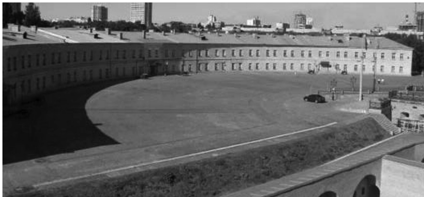
Фото 1. Киевская крепость 1839–1842 гг. В конце XIX в. здесь размещалась Киевская ВФШ