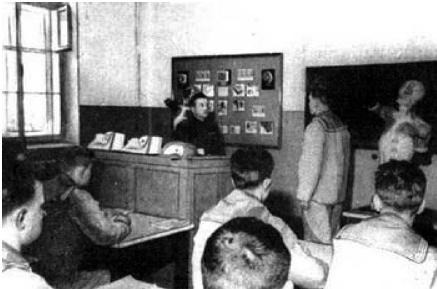
Рис. 5. Кронштадтское военно-морское медицинское училище. Курсанты роты фельдшеров на занятиях. 30-е года XX ст.

ским. На базе военно-медицинского училища было открыто «Омское медицинское училище № 3» республиканского подчинения.