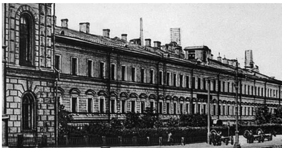
Рис. 2. Петербургская ВФШ в здании, расположенном на территории ИМХА

В начале XX в. в Вооруженных силах Российской империи имелось 6 ВФШ: Петербургская – на 300 «казенно-коштных» воспитанников (создана согласно приказу по военному ведомству от 1869 г., № 186) (рис. 2.); Киевская – на 350 воспитанников (Приказ по военному ведомству от 1898 г., № 340) (фото 1); Херсонская – на 200 воспитанников (Приказ по военному ведомству от 6.06.1879 г. № 6); Московская – на 300 воспитанников (Приказ по военному ведомству от 1871 г., № 241) (рис. 3); Тифлисская – на 200 воспитанников (Приказ по военному ведомству от 1895 г., № 313) и Иркутская – на 200 воспитанников (рис. 4.) (Приказ по военному ведомству от 6.06.1879 г. № 6) [5].