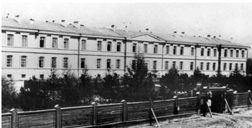
Рис. 4. Здание Иркутской военно-фельдшерской школы

В виду недостаточности названных выше 6 школ, разрабатывался вопрос об открытии еще двух – в городах Оренбурге и Ташкенте.