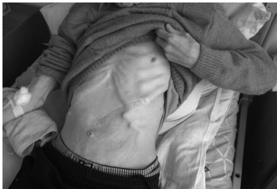
Рис. 2. Дефицит массы тела у пациента через 5 лет после гастрэктомии

та А составляла 45 кг при росте 170 см (ИМТ = 15,6) (рис. 2). До операции его масса составляла 60 кг (ИМТ = 18,5). В послеоперационном периоде масса тела снижалась, однако пациент выполнял рекомендации по питанию, и его максимальная масса после гастрэктомии составила 55 кг. После длительной болезни (пневмонии) масса тела упала до 45 кг. Следует упомянуть, что данный пациент положителен на анти-НСУ. Количество общего белка при поступлении было равно 54 г/л, альбумины составляли 26 г/л. Предъявлял жалобы на выраженную слабость, жидкий стул (что могло быть вызвано длительной антибиотикотерапией во время лечения пневмонии), отеки нижних конечностей. В ходе лечения пациенту, помимо энтерального дробного питания, вводили парентерально «Гепавил» (содержит аминокислоты вал, лей, иле и глюкозу).