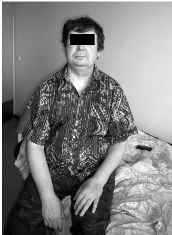
Рис. 2. Больной А., 51 год, через 1 месяц после назначенного лечения