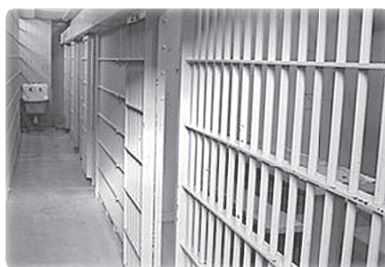
Рис. 4. Тюрьма г. Минска, где находился Г. Фалевич