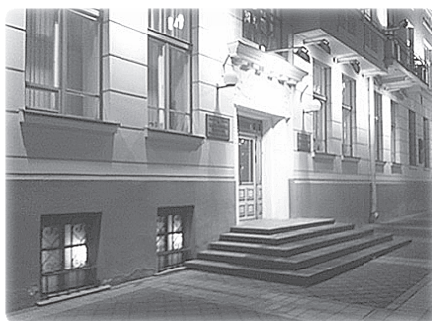
Рис. 3. Аптека №1 г. Минска по ул. Советской, 17