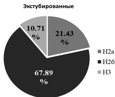
Рис. 2. ХСН в группе экстубированных