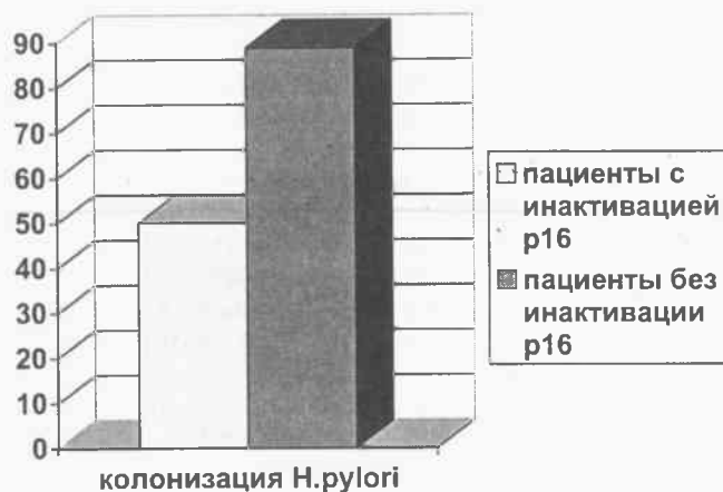
Рис. 4. Инактивация p16 и колонизация H. pylori у больных ПБ, p=0,008

Таким образом, всего в течение 12 месяцев эндоскопического наблюдения из 107 пациентов у 39 (36,5%) дисплазия не выявили, у 45 (42%) выявили изменения, характерные для низкой степени дисплазии, а у 23 (21,5%) — для высокой степени дисплазии. Можно отметить, что выявля-