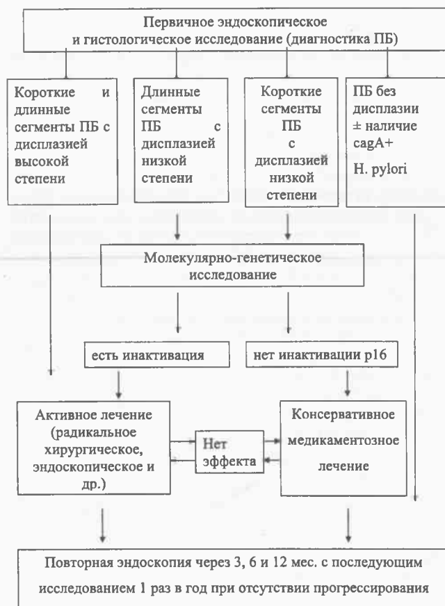
Рис. 5. Рациональный алгоритм ведения больных пищеводом Барретта (управление риском дисплазии/аденокарциномы пищевода)