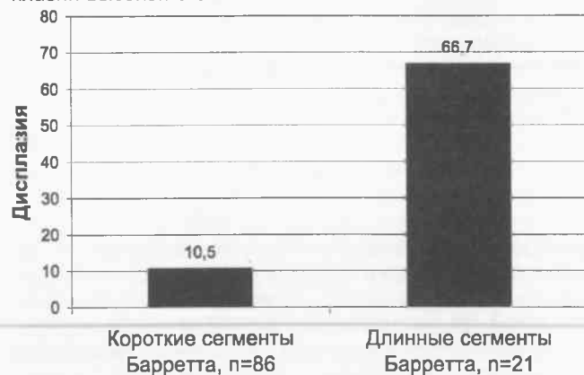
Рис. 3. Связь длины сегментов Барретта с дисплазией низкой степени и инактивацией p16 (различия достоверны, p=0,045 )

дисплазия низкой степени, а среди пациентов с ранее выявляемой дисплазией низкой степени у 2 больных отмечено прогрессирование степени дисплазии до высокой.