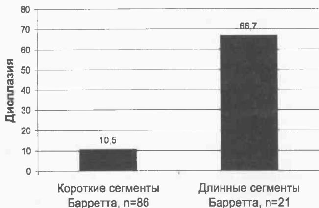
Рис. 2. Связь длины сегментов Барретта и наличия дисплазии высокой степени