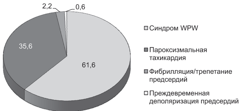
Рис. 1. Структура наджелудочковой тахикардии у детей с учетом кодов МКБ-10 (%)

мощью обращались дети с синдромом предвозбуждения желудочков, почти в 2 раза реже ( p < 0,05 ) – дети с пароксизмальной тахикардией, в единичных случаях отмечено трепетание/фибрилляция предсердий (11 человек) и преждевременная деполяризация предсердий (3 человека). Следует отметить, что только у 11,8% обследованных выявлена сопутствующая кардиальная патология.