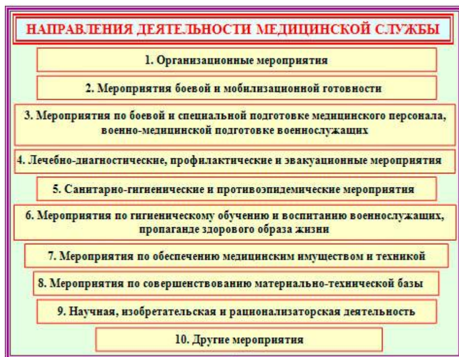
Рис. 1. Разделы (направления) мероприятий медицинского обеспечения войск

медицинских подразделений на сборах, конференциях и при непосредственном посещении указанных подразделений было принято решение о необходимости и целесообразности конкретизации формулировок задач по каждому направлению (разделу) мероприятий медицинского обеспечения войск как для базовых медицинских подразделений, так и медицинских подразделений воинских частей. В основу выделения разделов (направлений) мероприятий медицинского обеспечения войск положены современная формулировка понятия «медицинское обеспечение войск» и утвержденная структура плана работы медицинской службы воинской части на год (месяц) (рис.1).