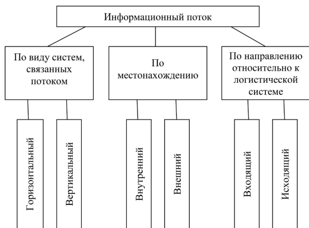
Рис 3. Виды информационных потоков

Развитие транспортной сети приводит к усилению связей между смежными организациями и выводит на первый план такое важное направление в логистике ЧС, как межрегиональная логистика. Главной особенностью межрегиональной логистики является то, что поставщик и потребитель медицинских услуг находятся в разных административно-территориальных единицах Украины