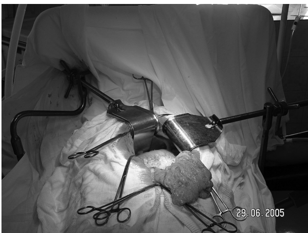
Рис. 1. Операционный доступ созданный при помощи ранорасширителя РГФ-1

Предлагаемый ранорасширитель состоит из кронштейна закрепленного к боковой планке операционного стола зажимным винтом, который надежно фиксирует стойку 1. Стойка 1 имеет две продольные лыски для предотвращения ее проворачивания вокруг своей оси. Верхний конец стойки имеет форму шестигранника, на который установлена шарнирная опора 3 с пазами. В шарнирную опору 3 установлен винт 4 с крючками 6,7 и приводным штурвалом 5. На шестигранник стойки установлена дополнительная консоль 2 с шарнирной опорой 8 и фиксатором положения 11. Шарнирная опора 8 выполнена вместе с карданом, через который пропущен винт 9 с размещенным на нем приводным штурвалом 10. На конце винта 9 имеется шаровой цан-