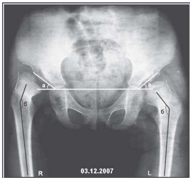
Рис – 1а. Рентгенограмма таза. Переднезадняя проекция. Врожденный вывих обоих бедер. Черным указаны шеечно-диафизарные углы (углы β) до операции (правый – 160° и левый-141°). Белым указаны ацетабулярные углы (углы α) до операции (правый – 37° и левый-43°).

Н ерешенность многих вопросов хирургического лечения врожденного вывиха бедра