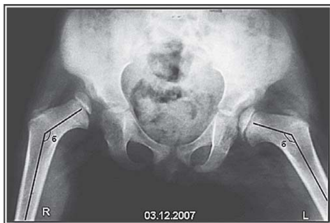
Рис – 1б. Рентгенограмма таза. Отведение и внутренняя ротация. Врожденный вывих обоих бедер. Черным указаны шеечно-диафизарные углы (углы β) до операции (правый – 140° и левый-136°). Угол патологической антеторсии справа-65°, слева-30°.

(ВВБ) на современном этапе частично связана с отсутствием четких критериев безуспешности консервативного вправления, протоколов и показаний к операции.