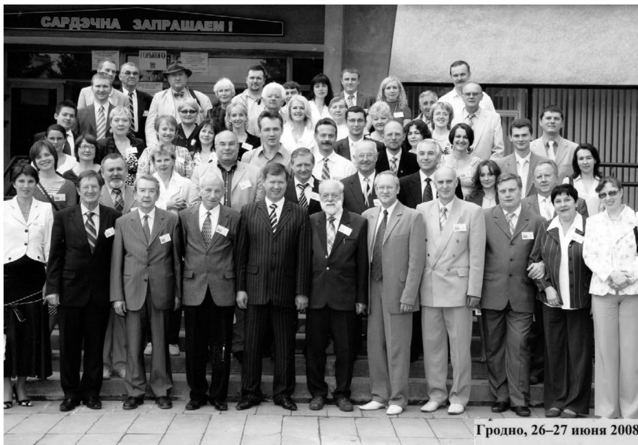
Рис. 2. Участники Международной научно-практической конференции «Актуальные вопросы морфологии», посвящённой 50-летию кафедры анатомии человека ГрГМУ, Гродно, 2008