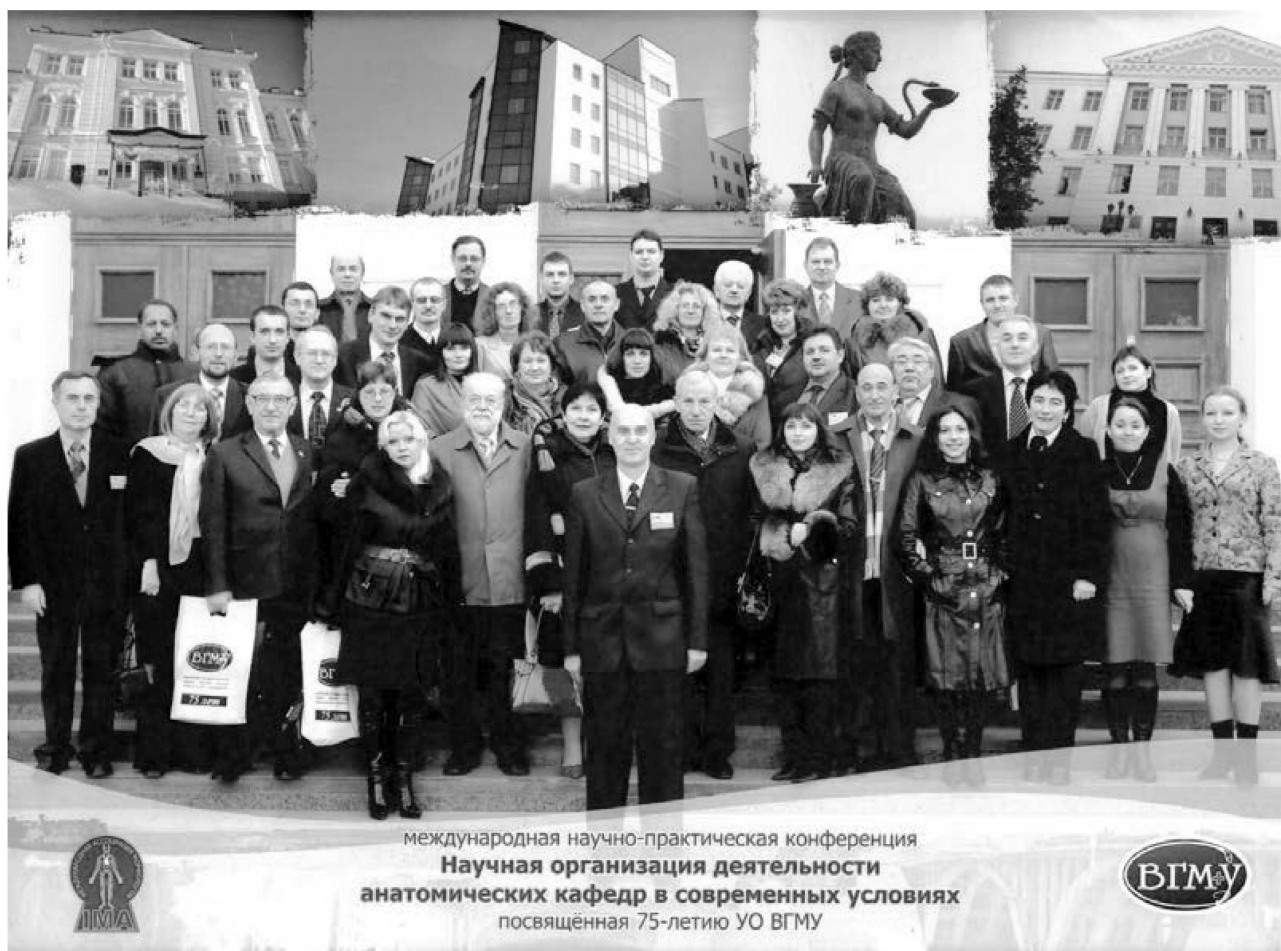
Рис. 5. Участники Международной научно-практической конференции «Научная организация деятельности анатомических кафедр в современных условиях», Витебск, 2009