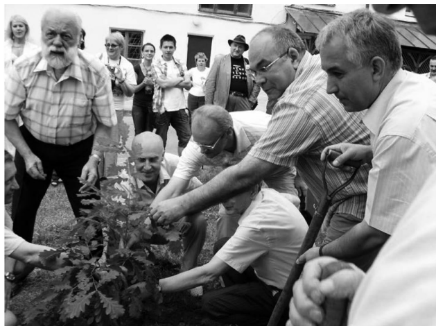
Рис. 4. Участники конференции сажают дуб во дворе кафедры анатомии человека ГрГМУ, Гродно, 2008

тебске (во время участия в работе Международной научно-практической конференции «Научная организация деятельности анатомических кафедр в современных условиях», Витебск, 2009) (рисунок 5).