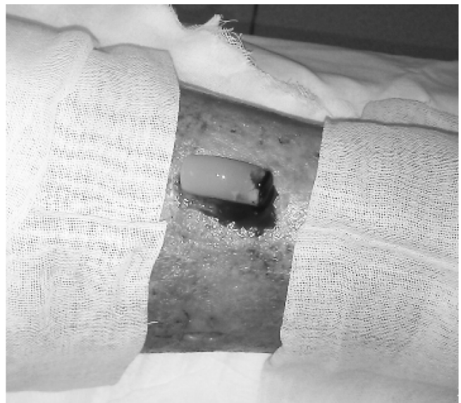
Рис. 2 — Обогащенный тромбоцитами фибрин, уложенный на раневую поверхность

Первые опубликованные исследования, проведенные in vitro , демонстрировали способность БоТП стимулировать пролиферацию целого ряда клеток: остеобластов [8], фибробластов [15], мезенхимальных стволовых клеток костного мозга [18], хондроцитов [4] и других. В то же время, были получены и противоположные результаты [6]. Скорее всего, это связано со значительным количеством способов получения БоТП, что, в свою очередь, может приводить к различным конечным продуктам. Положительный эффект, оказываемый на дифференциров-