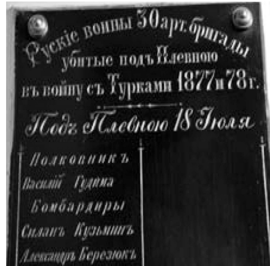
Фото 3. Памятная доска с именами воинов 30-й артбр, погибших под Плевной