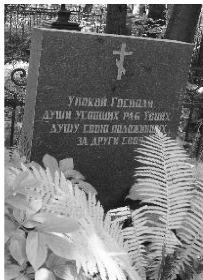
Фото 1. Братская могила воинов 119 и 120 пп 30 пд 4 АК РИА на Военном кладбище г. Минска (фото автора, 2014 г.)

Умерших от ран и болезней в госпитале военнслужащих в последствие хоронили на Минском Военном клад-