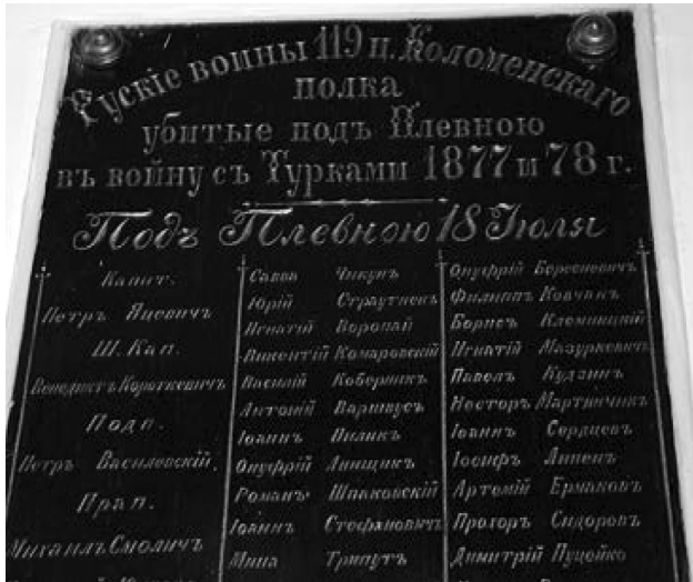
Фото 2. Памятная доска с именами воинов 119 пех. Коломенского полка, погибших под Плевной