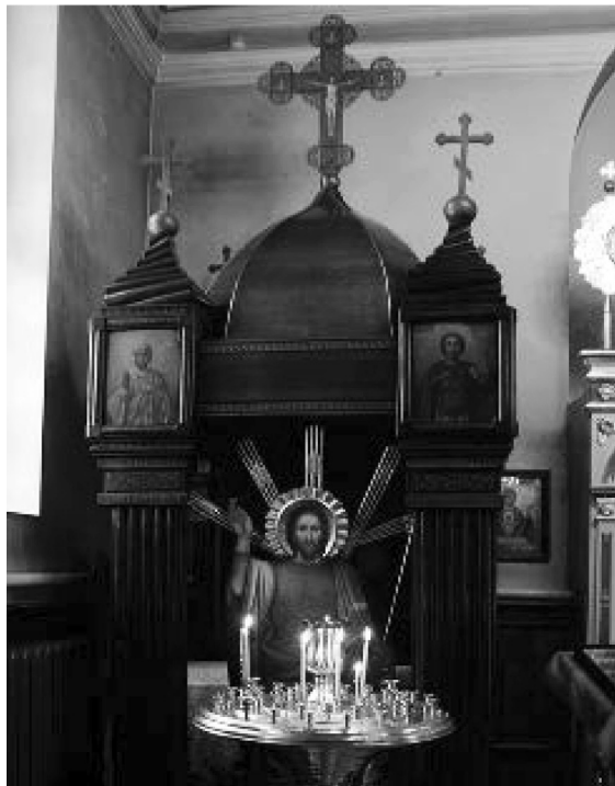
Фото 4. Походная церковь 119-го пехотного Коломенского полка