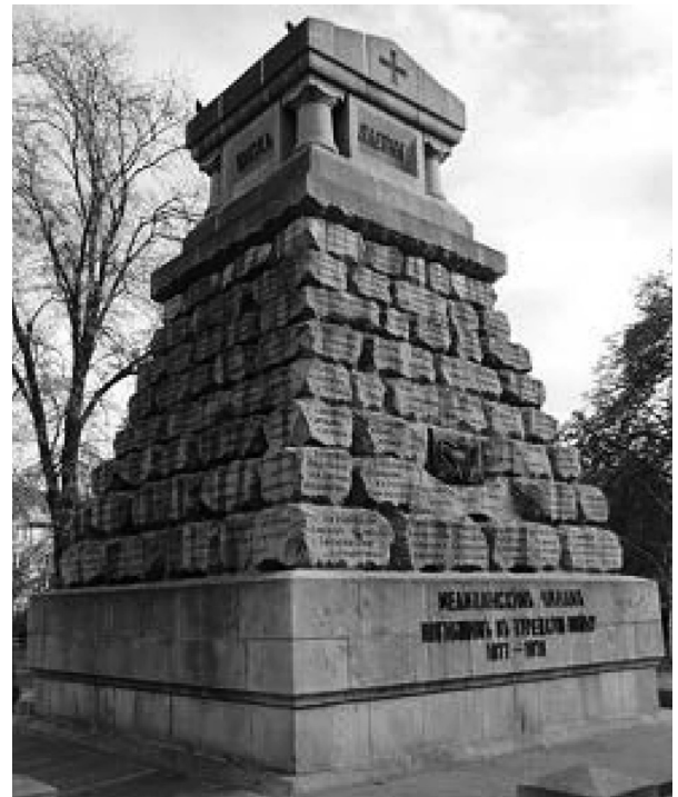
Фото 5. «Докторский памятник» 531 русскому медику, погибшему во время Русско-турецкой войны 1877—1878 гг.

И в заключении, в честь памяти славного подвига русского воинства, а с ним неразлучно следующего рука-об руку медицинского сословия хочется привести строки из воззвания к своим соотечественникам болгарского общественного деятеля, учителя и адвоката Ивана Георгия Чунчева из города Пазарджика: «...Нет в истории примера этому славному и прекрасному делу... Чтобы поднялись люди в суровой Сибири, далекой Казани, в холодном Архангельске, Астрахани, в славной Москве и великом Санкт-Петербурге и,