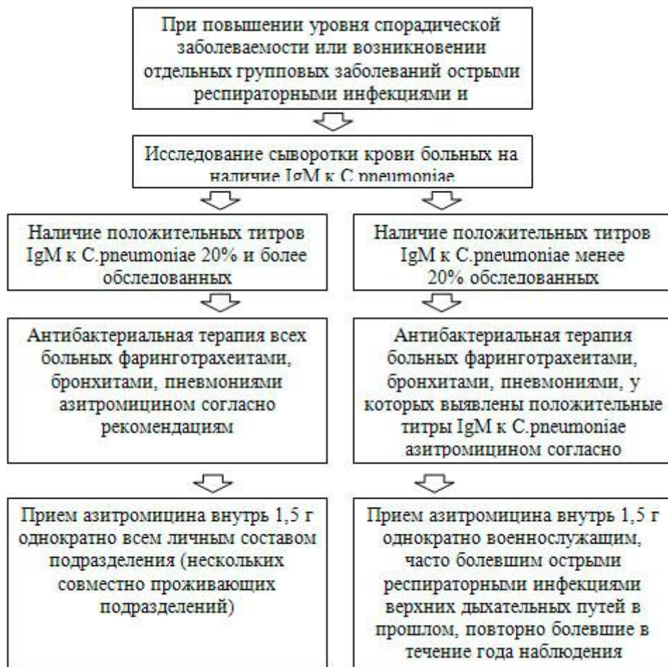
Рис. 2. Экстренная профилактика прерывающего типа

Использование того или иного типа экстренной профилактики в каждом конкретном случае решается в ходе эпидемиологического анализа заболеваемости личного состава коллектива.