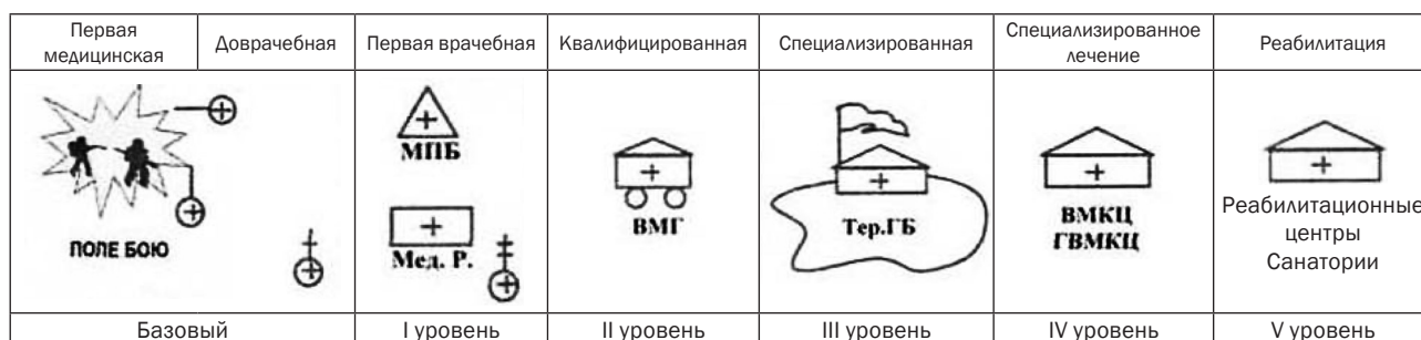
Рис. 1. Схема лечебно-эвакуационного обеспечения Вооруженных Сил Украины

Своевременное и качественное оказание хирургической медицинской помощи на этапах медицинской эвакуации (далее – ЭМЭ) является главным условием сохранения жизни и профилактики тяжелых осложнений у раненых и травмированных на войне, антитеррористических операциях, а также в мирное время, при ликвидации последствий чрезвычайных ситуаций и выполнении миротворческих операций. В условиях массового поступления раненых на ЭМЭ, важно выбрать оптимальный вариант организации хирургической помощи в конкретных боевых условиях. На рис. 1 приведена схема лечебно-эвакуационного обеспечения Вооруженных Сил Украины