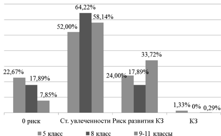
Рис. 2. Динамика распределения учащихся в зависимости от стадии формирования компьютерной зависимости на разных ступенях образования

Собственно компьютерная зависимость делится на 2 стадии: сформированной компьютерной зависимости (наблюдаются эмоционально-волевые нарушения и психическая зависимость) и тотальной компьютерной зависимости, проявляющейся признаками психической и физической зависимости, синдромом актуализации компульсивного влечения. Установление наличия данных стадий несколько меняет тактику последующих профилактических мероприятий и требует включения блока корригирующих