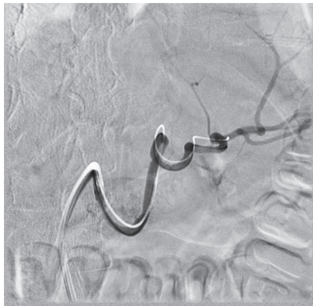
Рис. 2. Выполнение эмболизации проксимального сегмента селезеночной артерии

В послеоперационном периоде проводилась антибактериальная, терапия, рациональная анальгезия с исключением нестероидных противовоспалительных средств, восстановление водно-электролитного обмена, коррекция параметров системы гемостаза, при не-