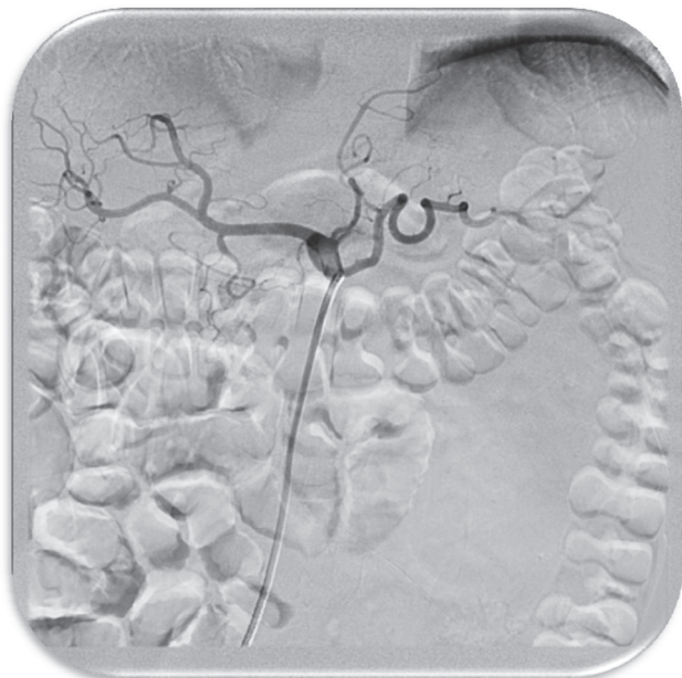
Рис. 1. Катетеризация чревного ствола

ную эмболизацию проксимального сегмента селезеночной артерии являлось, то, что одновременно выполняли ФЭГДС исследование, при котором визуализировали источник кровотечения, и в случае констатации факта достижения надежного гемостаза прекращали процесс редукции кровотока по селезеночной артерии (прекращали дальнейшую установку спиралей).