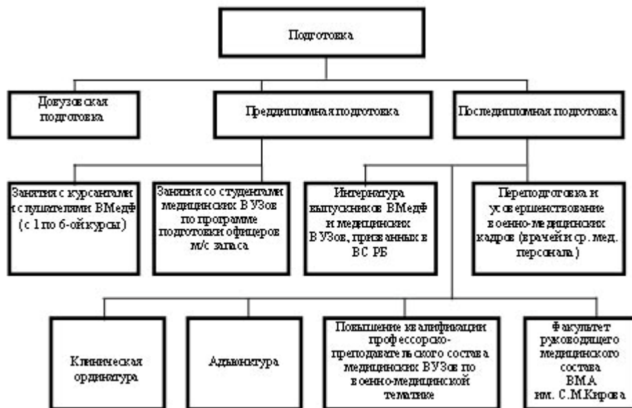
Рис. 1. Подготовка военно-медицинских кадров в Республике Беларусь

Для осуществления подготовки военно-медицинских кадров в Республике Беларусь имеется профессорско-преподавательский состав и подготовлена материальная база - создана сеть образовательных учреждений (рис. 2).