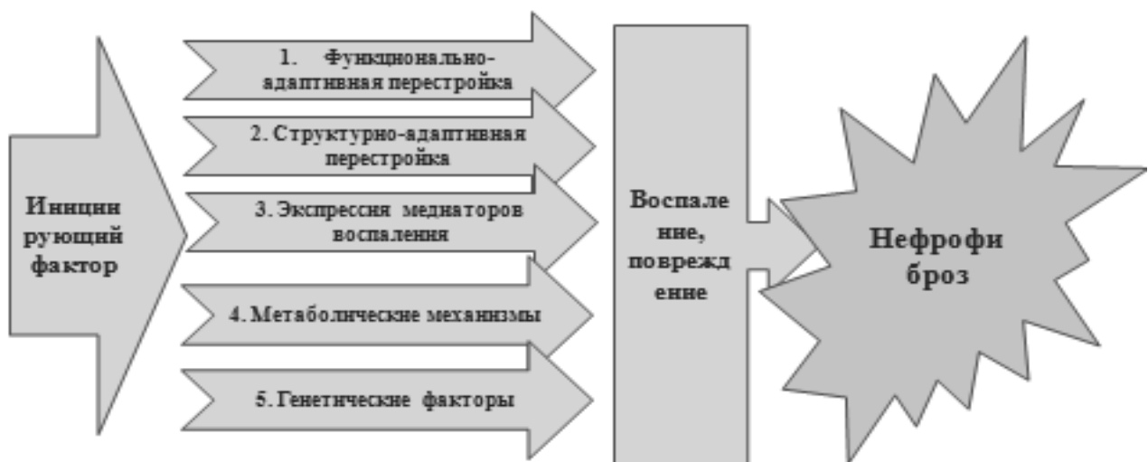
Рис. 3. Современная концепция ХБП.

В основе ХБП лежат универсальные неспецифические механизмы, приводящие к гломерулосклерозу, тубулоинтерстициальному склерозу, нефрофиброзу.