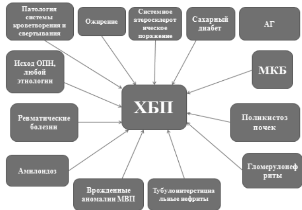
Рис. 2. Причины развития ХБП самые разные

Существуют качественные и количественные методы оценки экскреции белка с мочой. Качественное определение экскреции белка с мочой для первоначальной оценки состояния почек выполняют с использованием тест-полосок. У пациентов с положительным тестом (1+ или более) следует оценивать экскрецию белка с мочой количественными методами — соотношением белок/Кр или А/Кр, в течение 3 месяцев. Пациентов с двумя или более положительными количественными тестами с интервалом от одной до двух недель, следует рассматривать как имеющих персистирующую патологическую экскрецию